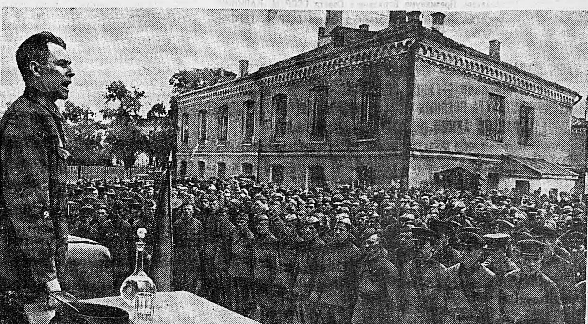
Митинг в Н части, посвященный назначению Председателя Совета Народных Комиссаров СССР товарища И. В. Сталина Народным Комиссаром Обороны СССР. Выступает старший политрук В. Мельников.