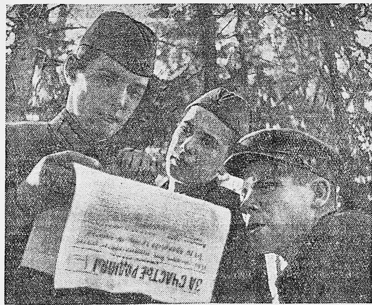
В перерыве между боями бойцы читают фронтную газету.

Бойцы, принятые в комсомол, поклялись не жалеть ни крови, ни самой жизни для достижения полной победы над фашизмом.