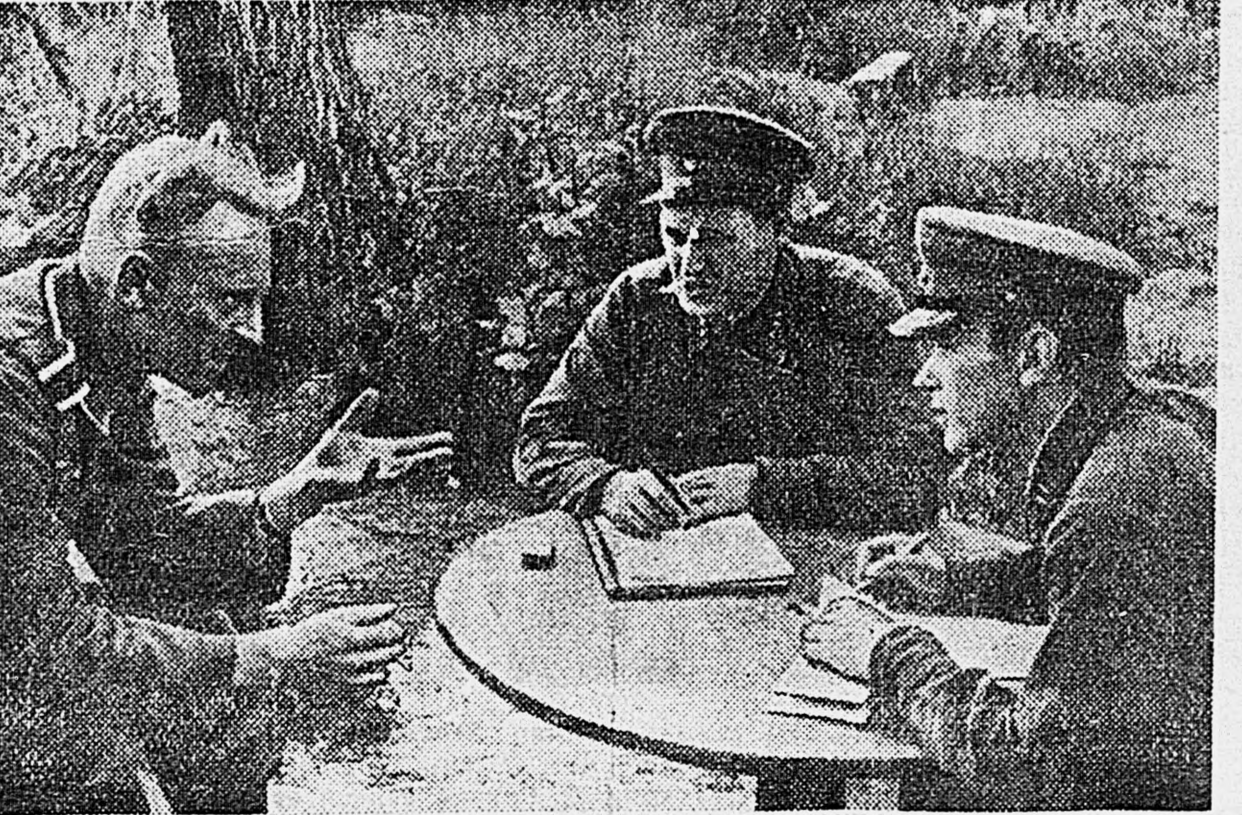
Действующая армия. На снимках (слева направо): 1. Раздача оружия партизанам в прифронтовой полосе. 2. Допрос немецкого пленного.

Фашистский зверь голоден. Он подбирается к нашему хлебу. Бдително охраняйте продовольствие! При вынужденном отходе ничего не оставляйте врагу. Пусть фашистские гады подохнут с голоду!