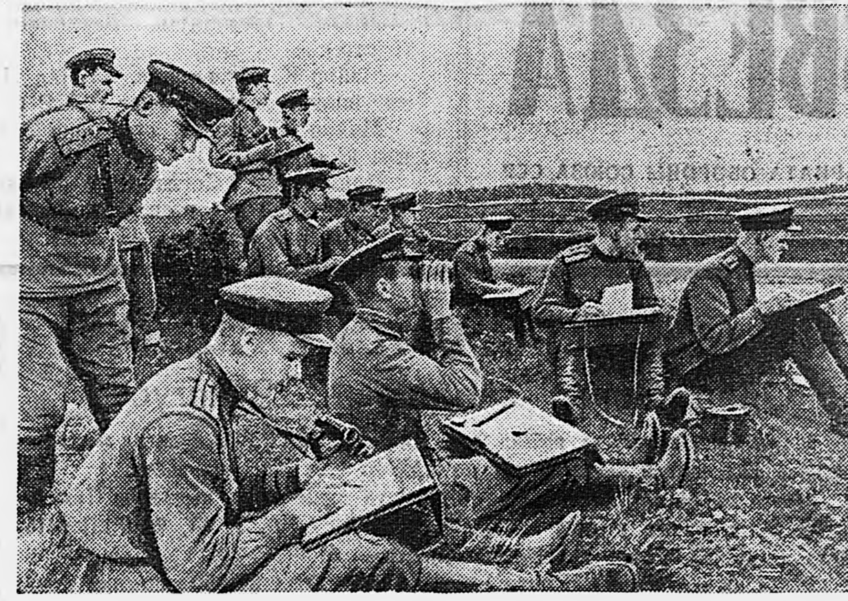
Занятие по топографии слушателей Артиллерийской ордена Ленина имени Державского академии Красной Армии.

Не будь этих досадных промахов, летное учение в Н-ской части пришлось бы несомненно еще большим ползу. Майор А. ХАПАЕВ.