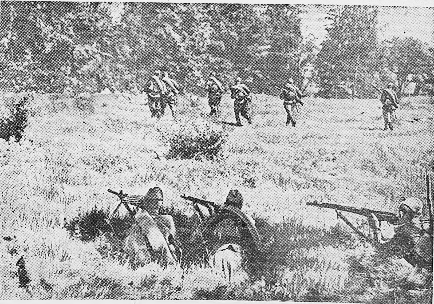
На тактических занятиях в Н-ской части.