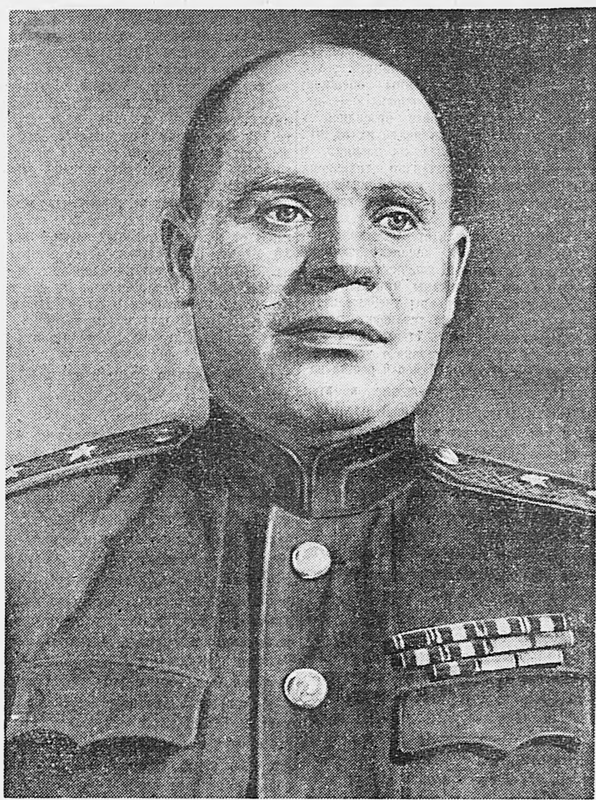
Генерал-лейтенант войск связи И. Н. Ковалев. В период Отечественной войны тов. Ковалев был начальником связи Ленинградского фронта.

2-й ДАЛЬНЕВОСТОЧНЫЙ ФРОНТ, 22 августа. (По телеграфу).