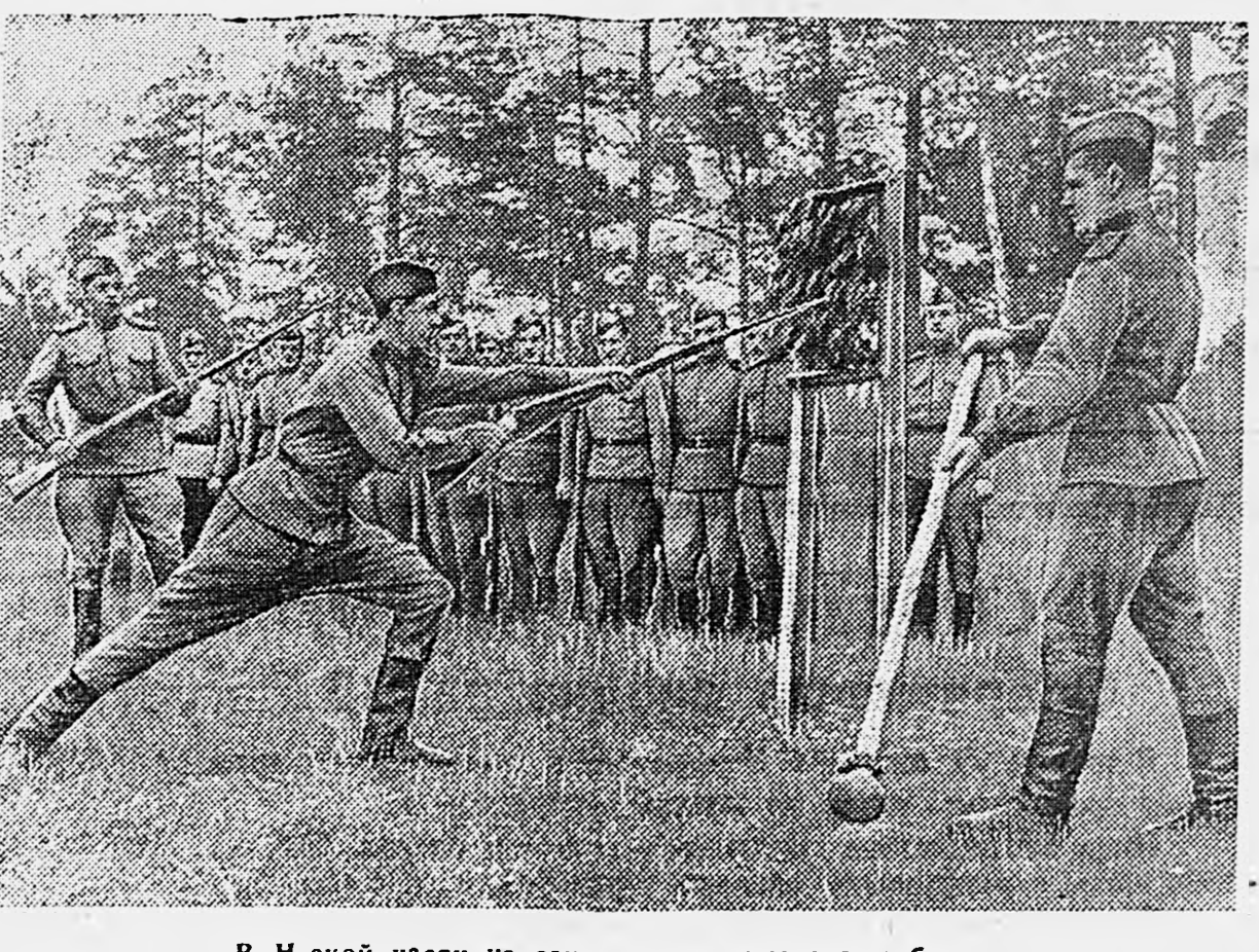
В Н-ской части на занятиях по штыковому бою.