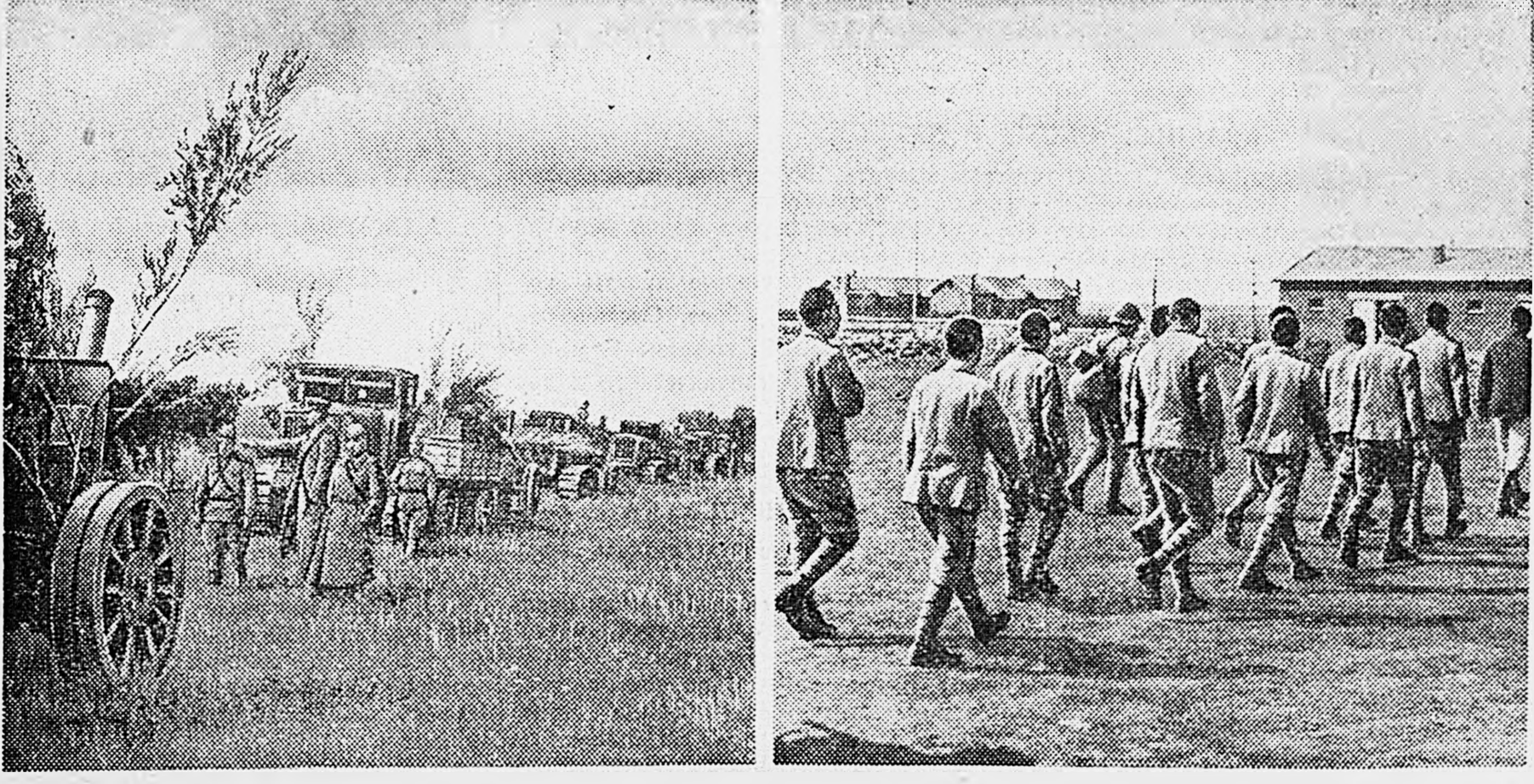
В МАНЬЧЖУРИИ. 1. Артиллерия Красной Армии на марше. 2. Пленные японские солдаты.

Так нам рисуется, конечно, в общих чертах картина боя стрелковой роты, которая атакует позиционную оборону противника на участке прорыва.