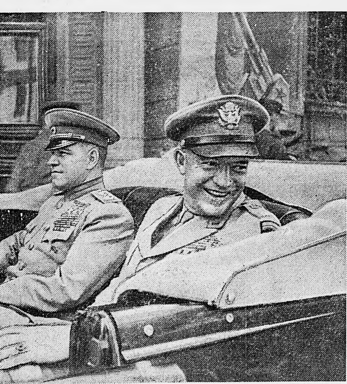
Маршал Жуков и генерал армии Эйзенхауэр в Ленинграде.

Вопрос: «Считаете ли вы, что в настоящее время существует какая-то возможность создания крупной социалистической партии в Соединенных Штатах Америки?»