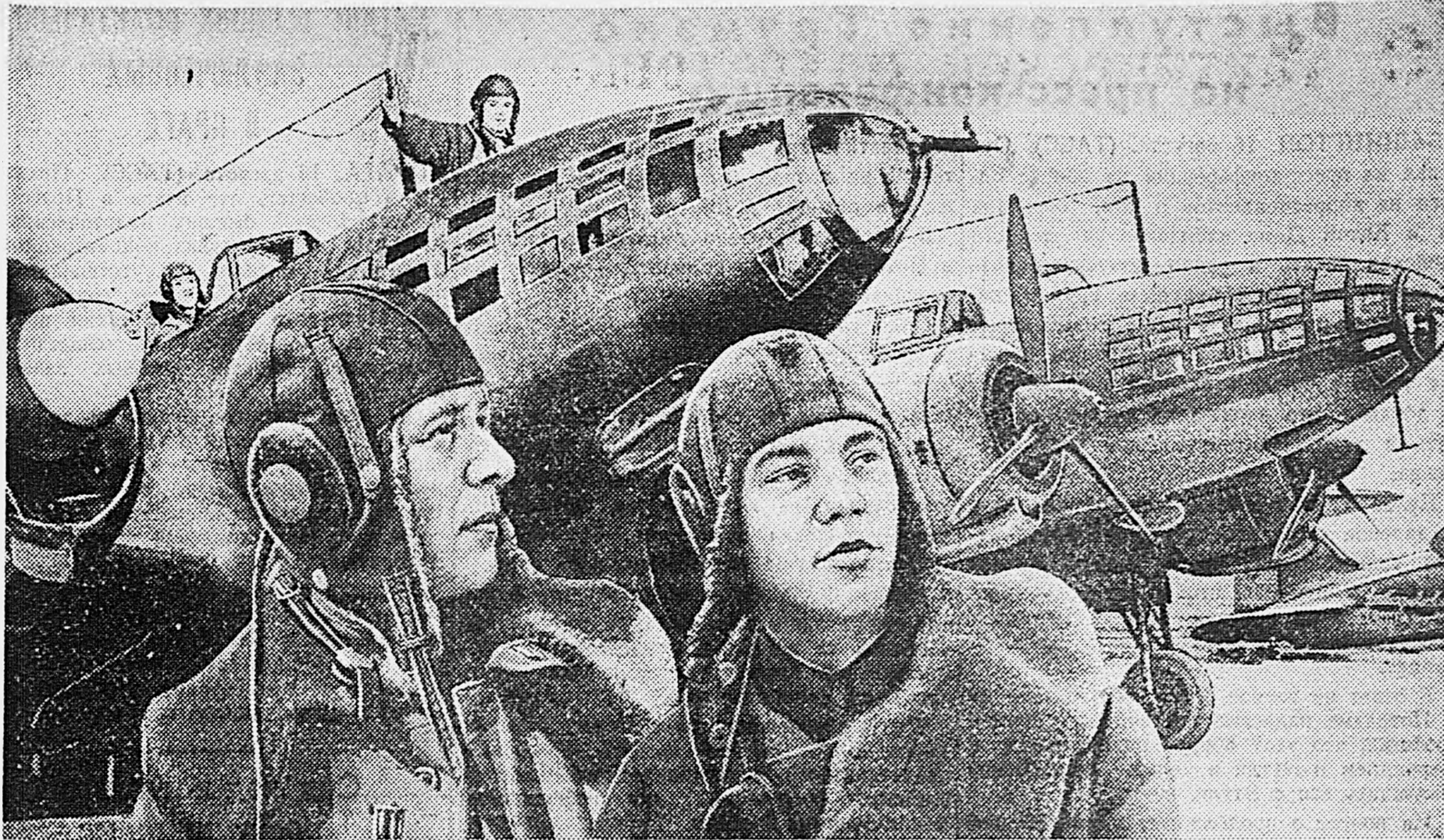
Летчики-бомбардировщики дважды Герои Советского Союза — гвардии подполковник А. И. Молодчий (справа) и гвардии капитан В. В. Сенько.