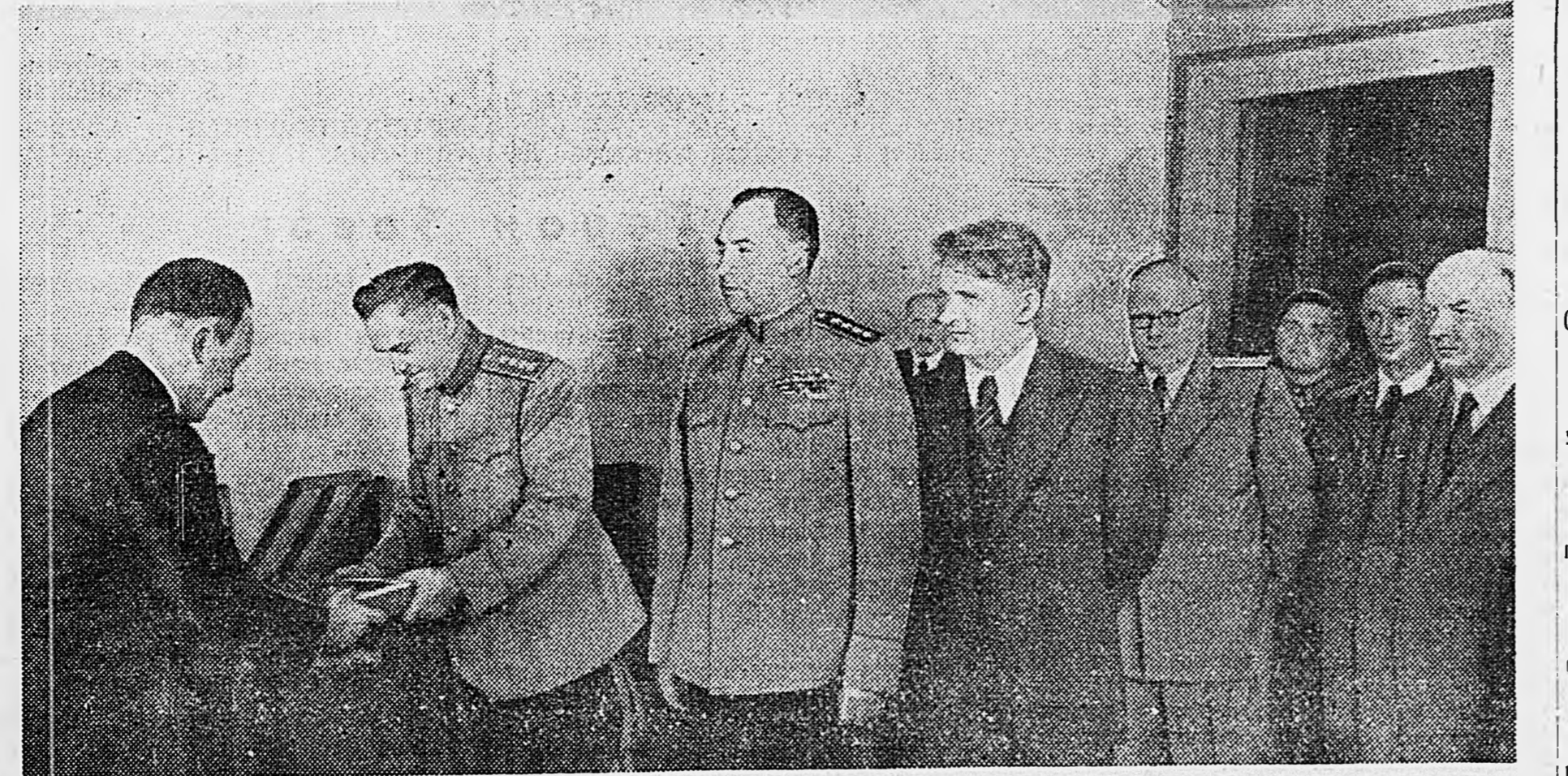
Президент Крайовой Радзы Народовой Польской Республики г-н Б. Берут вручает награды генералу армии Н. А. Булганину

Церемония вручения орденов прошла в дружественной и теплой обстановке. (ТАСС).