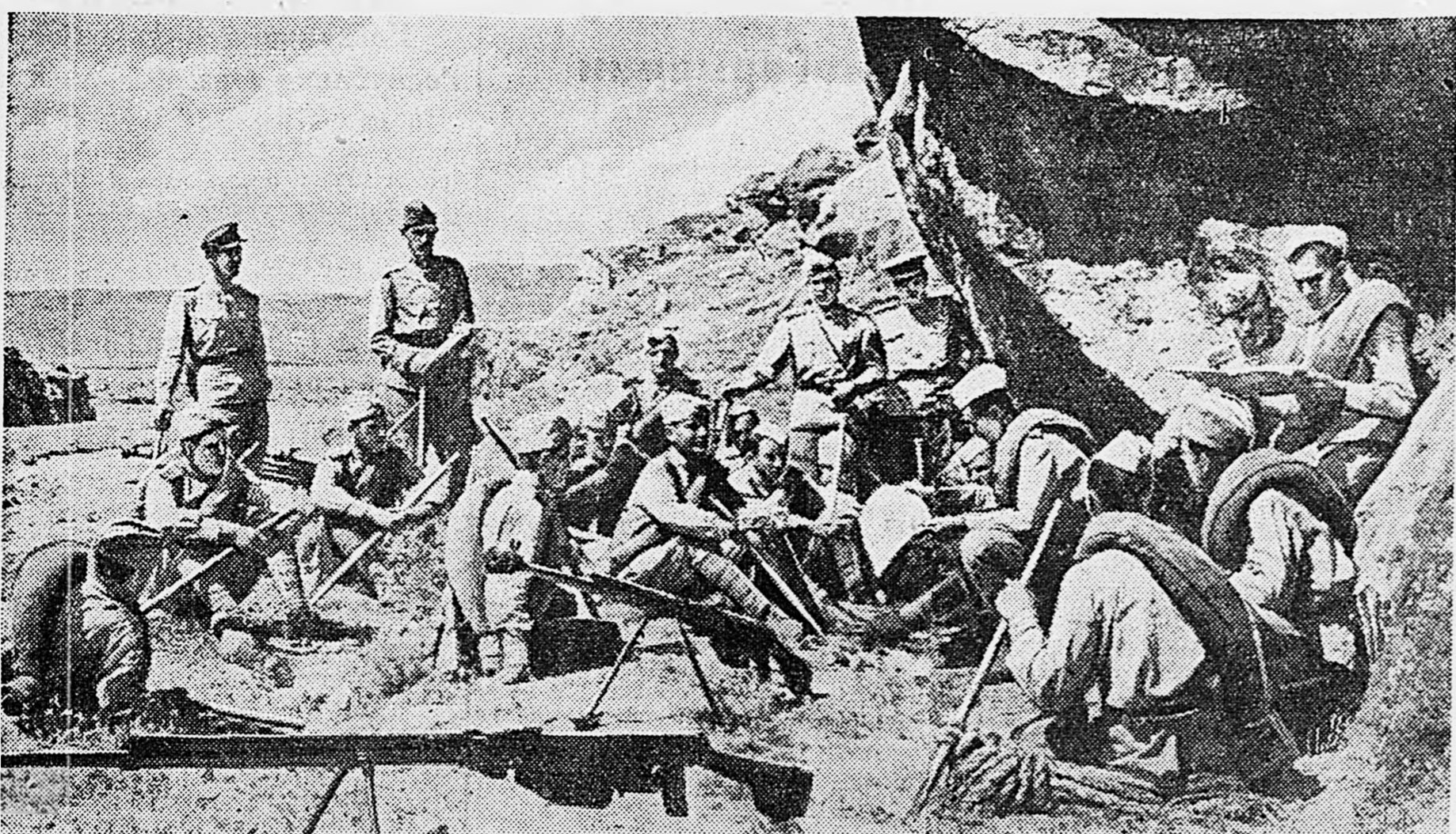
ЗАКАВКАЗСКИЙ ФРОНТ. Агитатор ефрейтор Ш. Джанирашвили читает бойцам газету на привале.