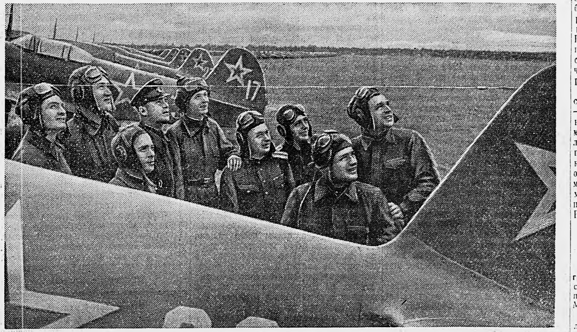
На аэродроме Высшей офицерской школы воздушного боя. Летчики наблюдают за полетами своих товарищей.

Взглянув творческое наследие великого летчика нашего времени, можно увидеть в нем характерные черты традиционных исканий русских авиаторов. Конечно, великие достижения В. Чкалова, разрывавшиеся в блестящую эпоху сталинских пятилеток, многократно перекрывают скромные успехи первых русских летчиков. Но для нас важно, что к решению своих задач В. Чкалов шел теми же путями неустанных поисков, того же, был так же требователен к себе и выше всего ставил интересы Родины. Каждую свою удачу в воздухе он расценивал, как ступень к следующему, еще более значительному достижению.