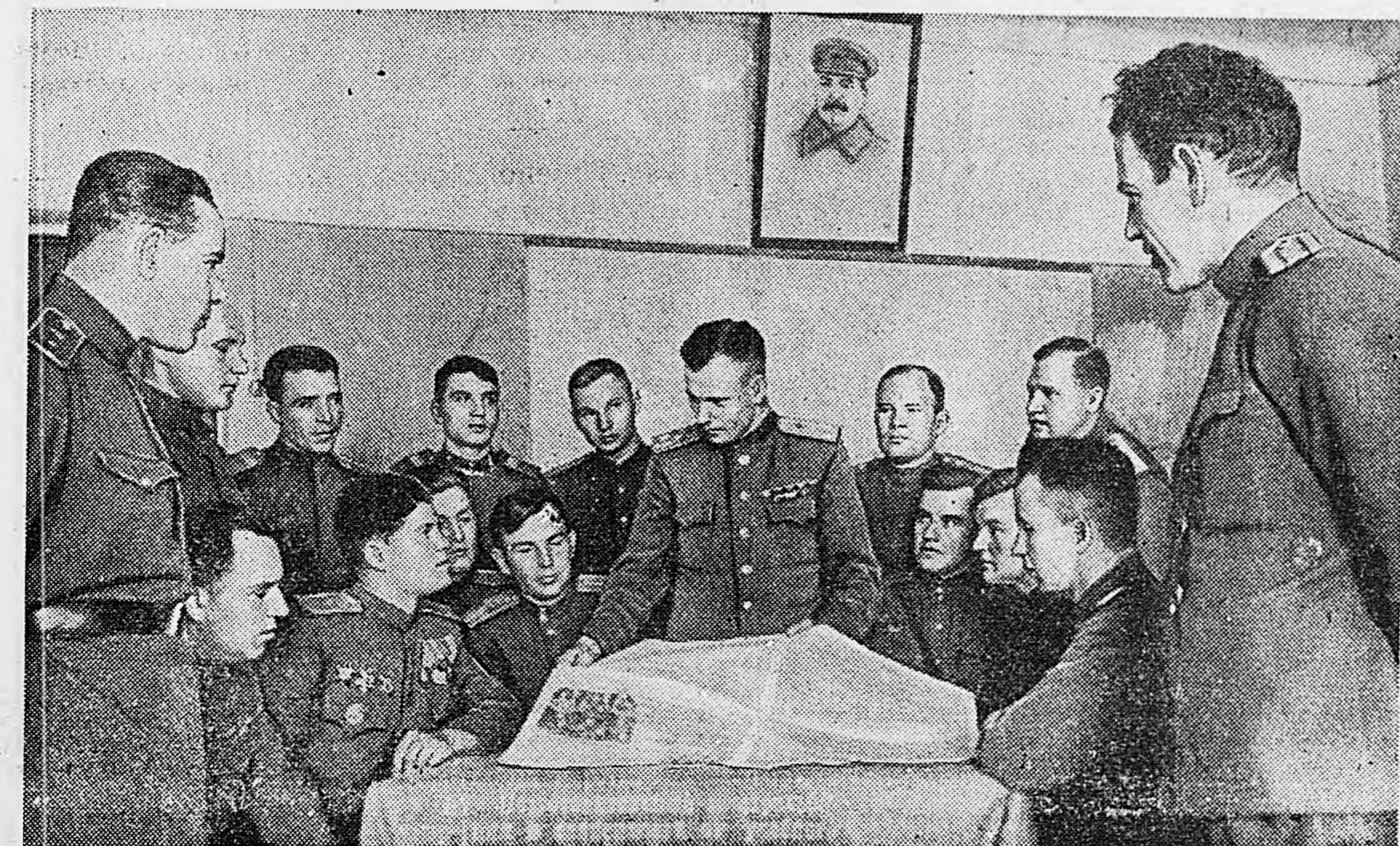
Группа офицеров Н-ской части за обсуждением исторических решений Берлинской Конференции трех держав.

Ткачихи обязались выработать в августе сверх плана 95 тысяч метров ткачей для угольной промышленности страны.