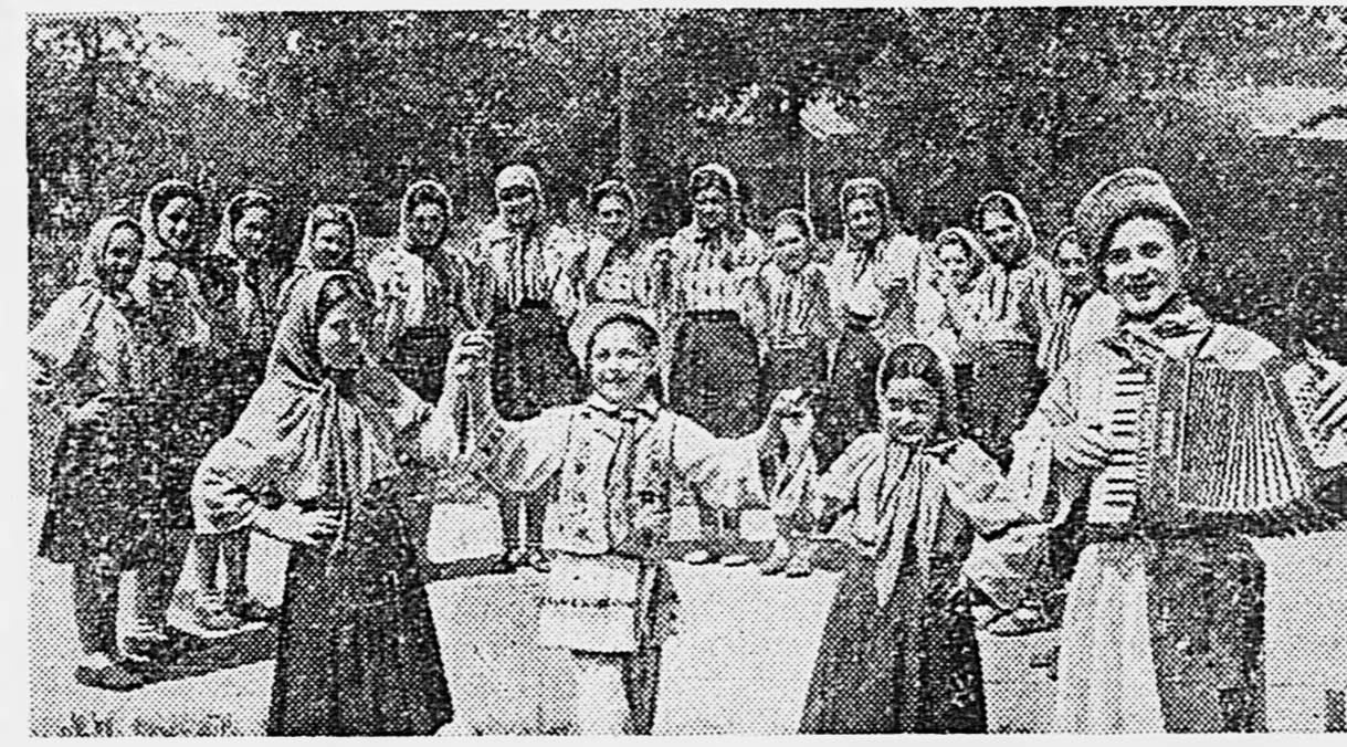
Более трех тысяч школьников Молдавии участвовали в республиканском смотре художественной самодеятельности. На снимке: дети исполняют гашиональный молдавский танец.

Совещание приняло обращение ко всем учителям и работникам народного просвещения Украины.