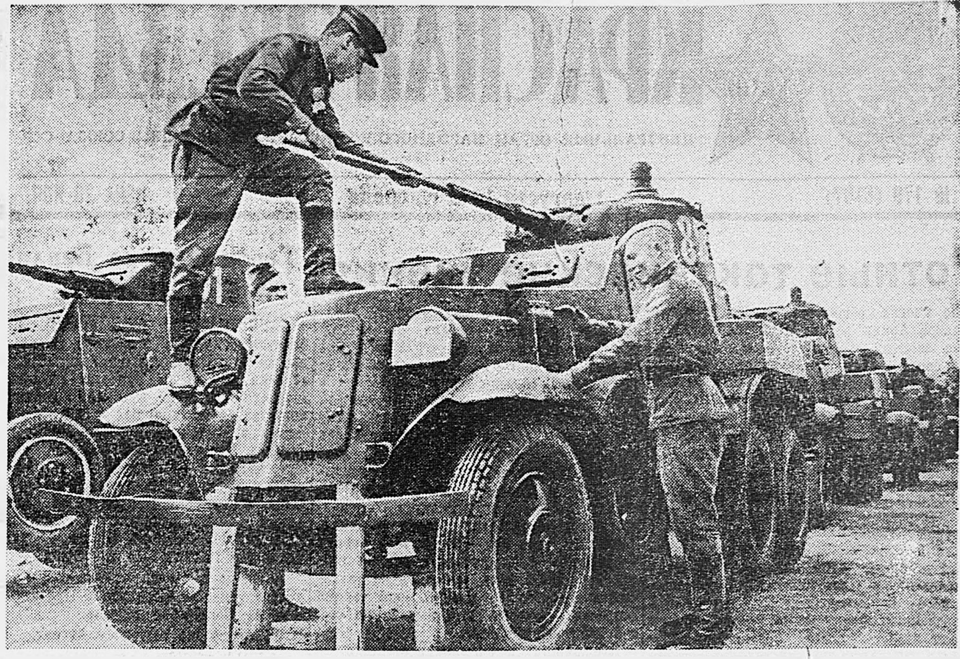
В парке Н-ской танковой бригады. Чистка материальной части.