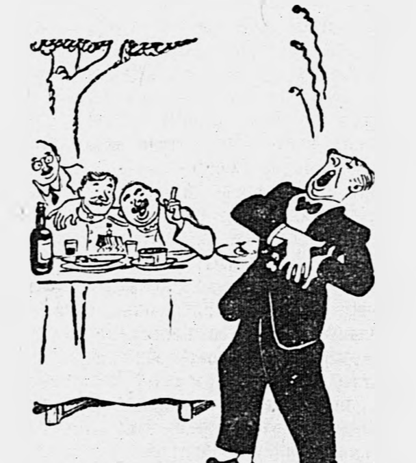
...артист эстрады Семиколодский спел неоплатительное песню...