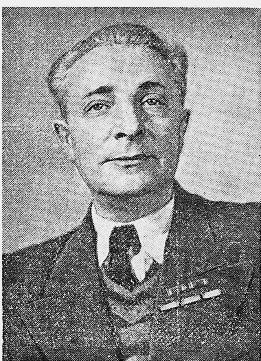
Герой Социалистического Труда Б. И. Збарский.