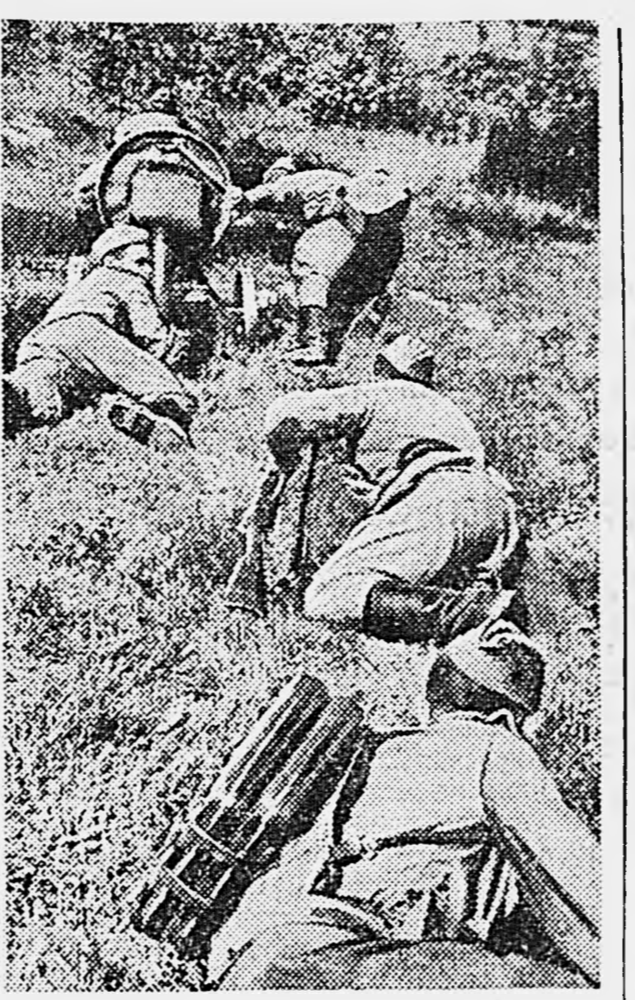
Боевая учеба в Н-ской части. Расчет миномета выдвигается на огневую позицию.