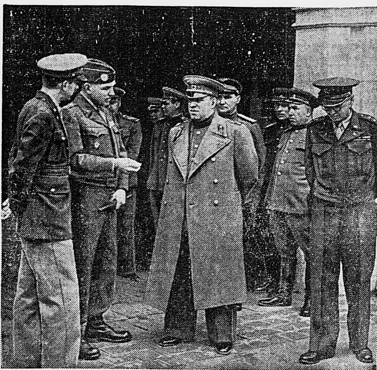
Встреча Маршала Советского Союза Г. К. Жукова с командующим американской зоной в Берлине ген. Паркс.