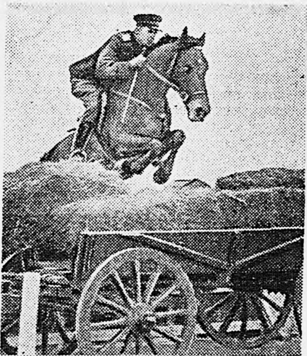
Боевая учеба кавалеристов. На снимке: преодоление препятствия.

кового полка позиционной обороны противника с целью прорыва». Несмотря на неблагоприятную погоду, курсанты и офицеры действовали так, как этого требует боевая обстановка. За три дня учений они совершили стокилометровый марш, успешно выполнив ряд боевых задач.