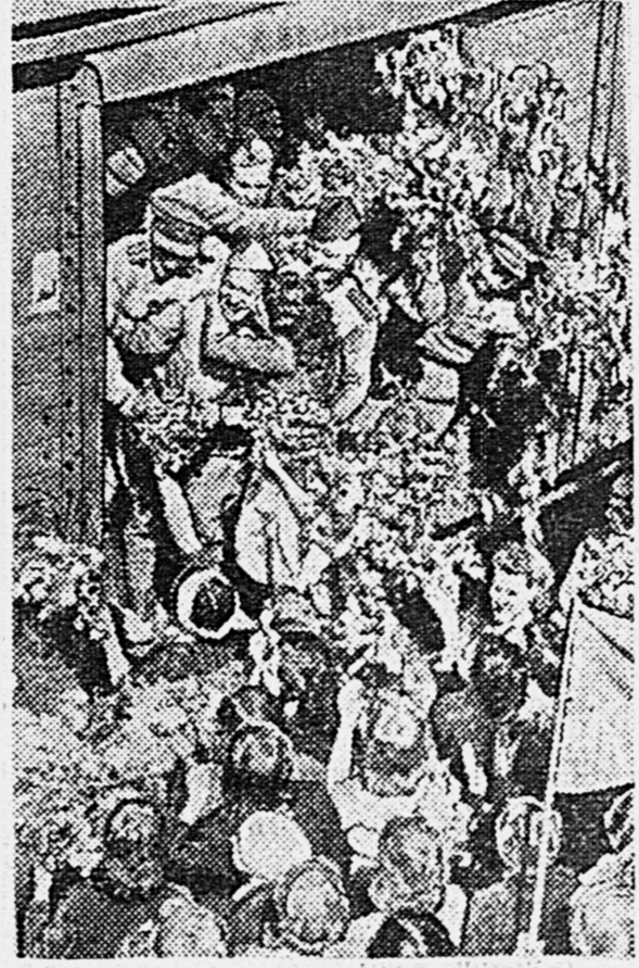
МОСКВА, 17 ИЮЛЯ 1945 ГОДА. Встреча демобилизованных воинов Красной Армии.