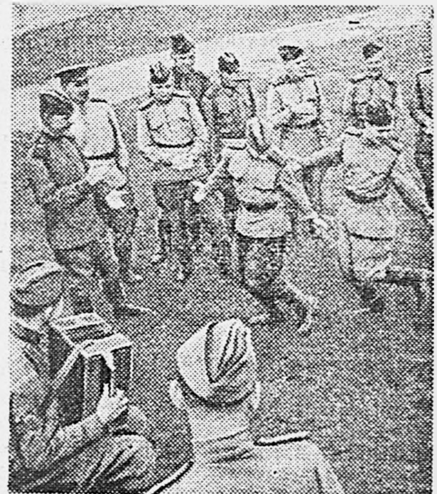
В часы досуга в лагере Н-ской части.

Партийно-хозяйственный актив одобрил инициативу колхозов «Призыв» и им. Октябрьской революции о развертывании социалистического соревнования за лучшую встречу воинов-победителей. (ТАСС).