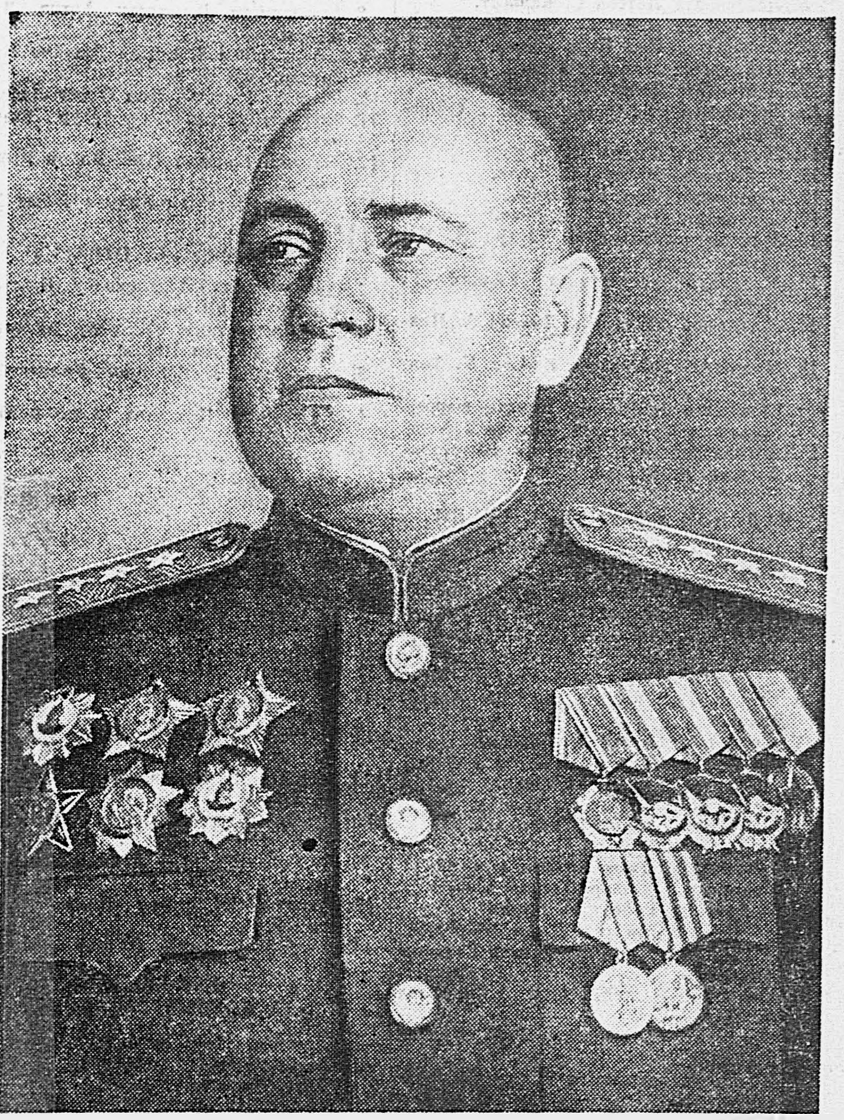
Генерал армии М. В. Захаров. В период Великой Отечественной войны тов. Захаров был начальником штаба 2-го Украинского фронта.