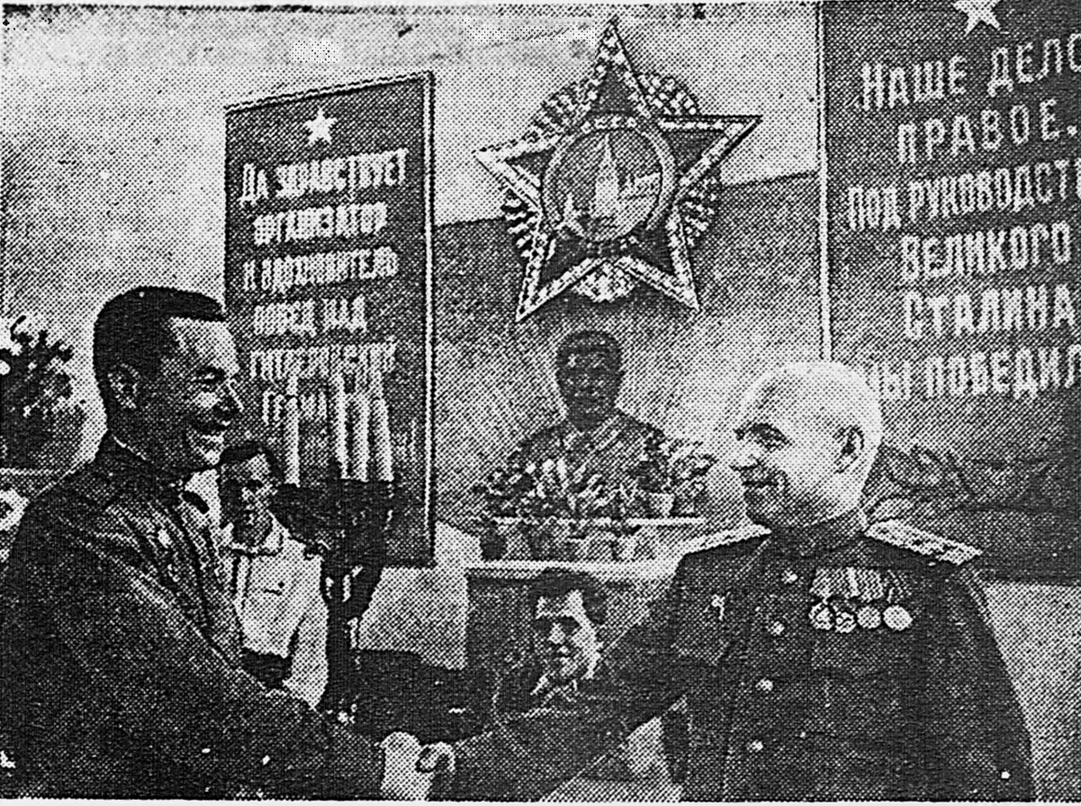
В Москве, на Салово-Куларинской улице, по приему 114-й школы работает пункт по приему демобилизованных Советского района.

Бойцов и сержантов армии-победителей встречают на пункте с исключительной теплотой и радушием, как дорогих и почетных гостей. Оформление документов проходит быстро, четко и организованно. Пока выписываются необходимые документы, демобилизованные проходят в большую комнату, где дежурят сотрудники различных отделов районного исполнительного комитета Совета депутатов трудящихся. У одного стола выдают продовольственные и промтоварные карточки. Рядом — стол отдела кадров. Здесь демобилизованному дают исчерпывающие сведения о том, куда и на какую работу он может поступить. Несколько дальше — стол отдела по государственному обеспечению и бытовому устройству семей военнослужащих. У стола дежурит сотрудник районного финотдела, который проверяет обязательные государственные займы.