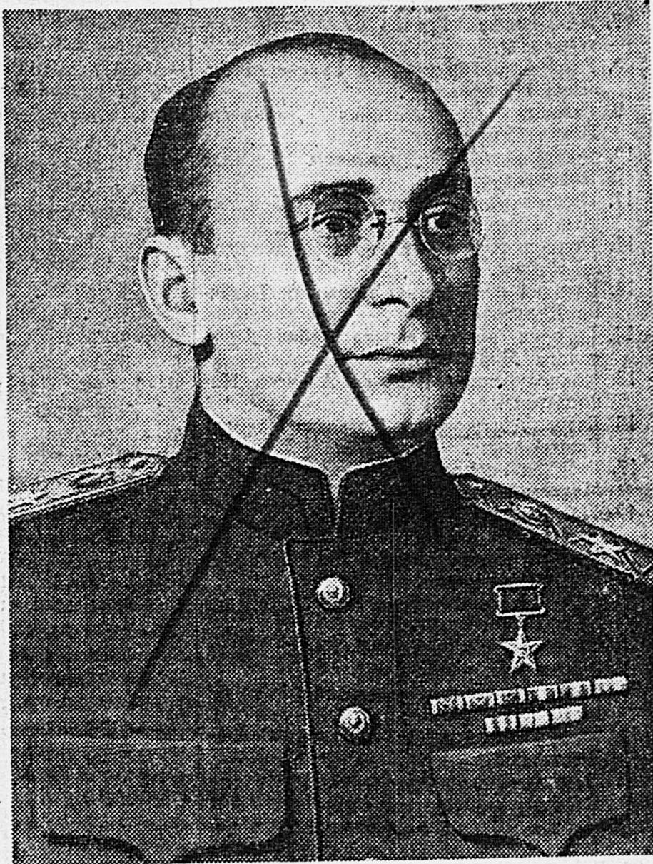
Маршал Советского Союза Л. П. БЕРИЯ.