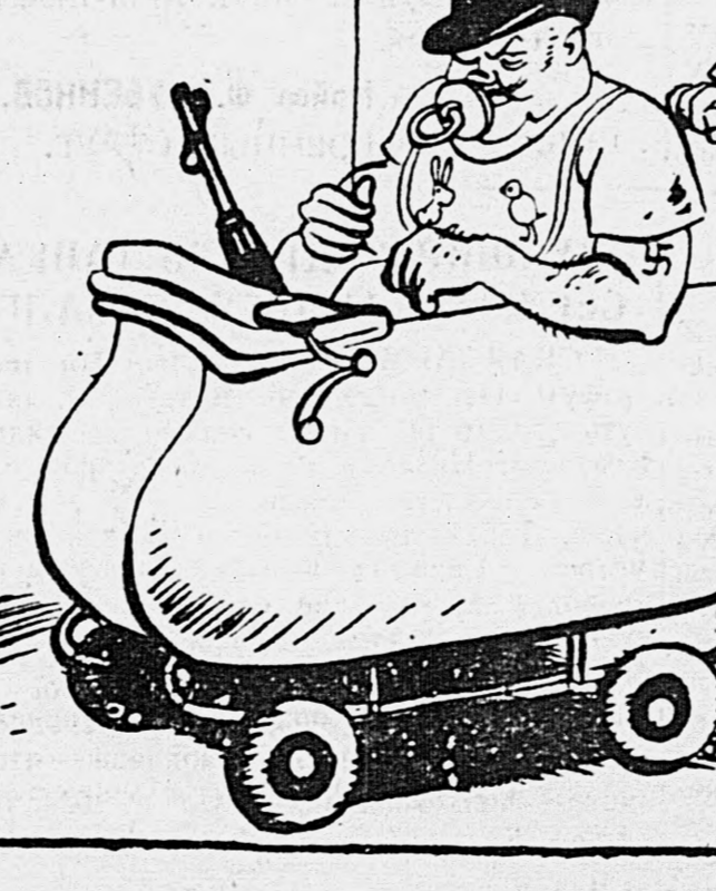
Папа, слишком нежный к Папе.

«Посол» польского эмигрантского «правительства» при Ватикане Казимир Пале продолжает там рассматривать, как «представитель епископальной власти, которую признает церковь».