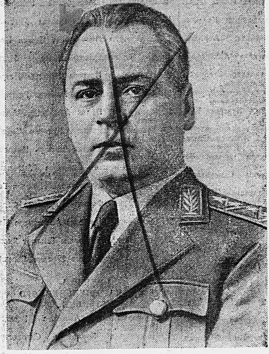
Генерал армии В. Н. МЕРКУЛОВ.

Председатель Президиума Верховного Совета СССР М. КАЛИНИН. Секретарь Президиума Верховного Совета СССР А. ГОРКИН. Москва, Кремль, 9 июля 1945 года.