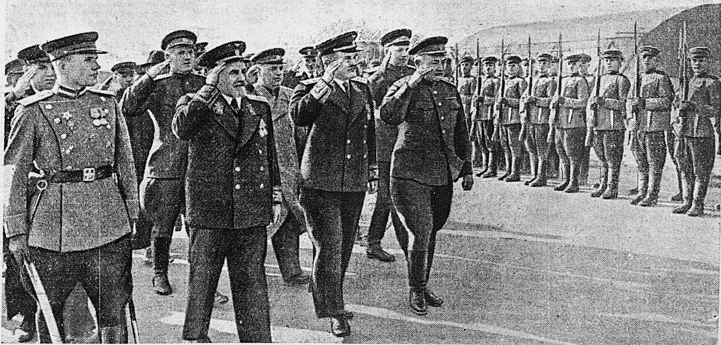
Прибытие в Москву Премьер-министра Монгольской Народной Республики Маршала Чойбалсана. На снимке: В. М. Молотов, Маршал Чойбалсан, В. Н. Меркулов, С. А. Лозовский и сопровождающие их лица обходят почетный караул.