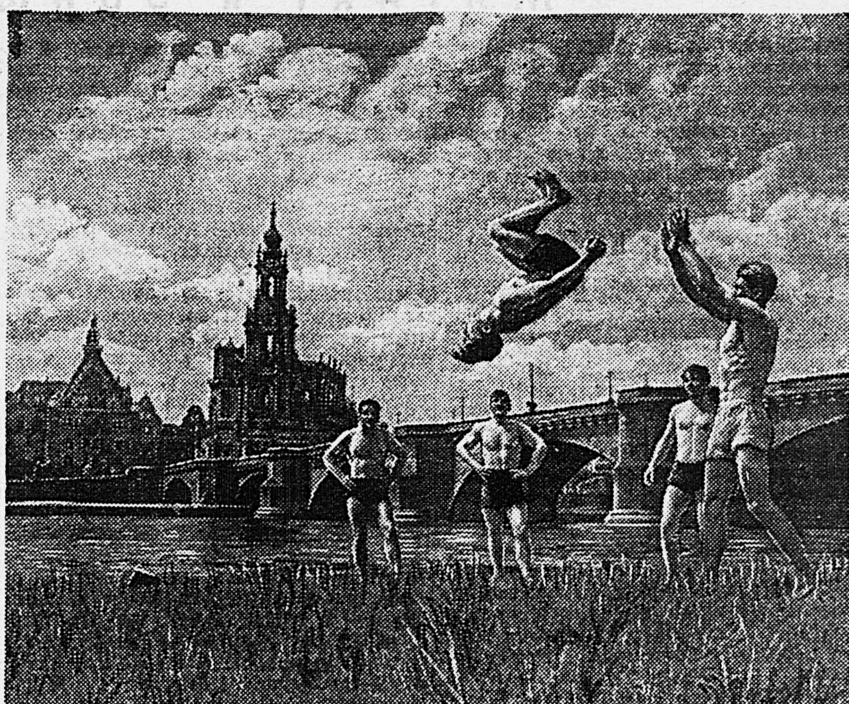
В выходной день на берегу Эльбы в Дрездене. Группа советских офицеров на гимнастической тренировке.