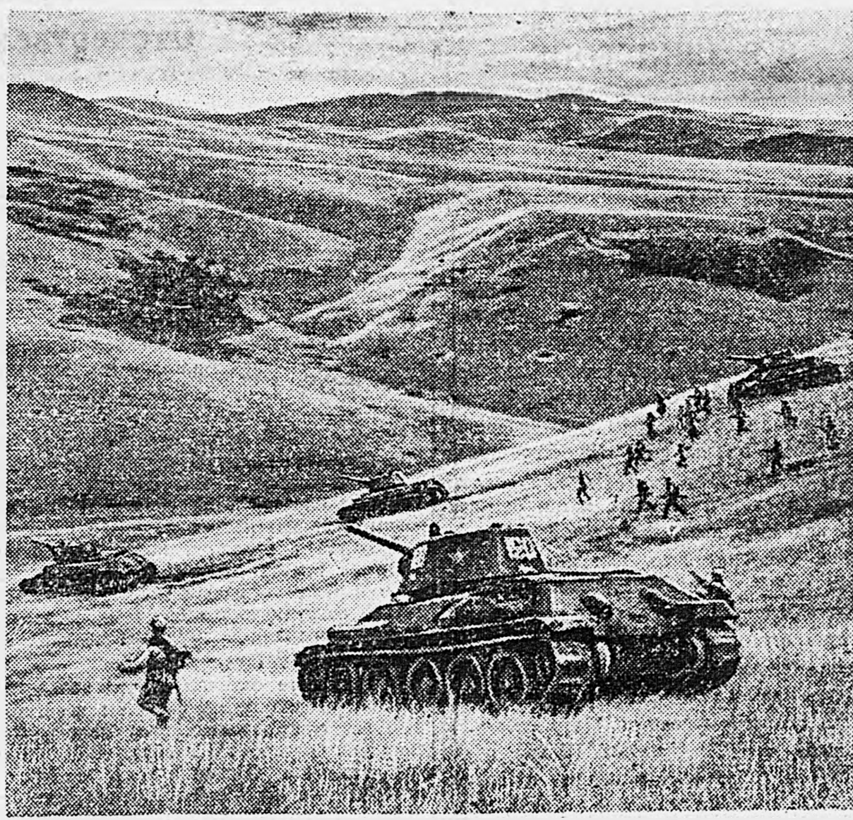
ЗАКАВКАЗСКИЙ ФРОНТ. На тактических учениях в горах. Танки и пехота в наступлении.