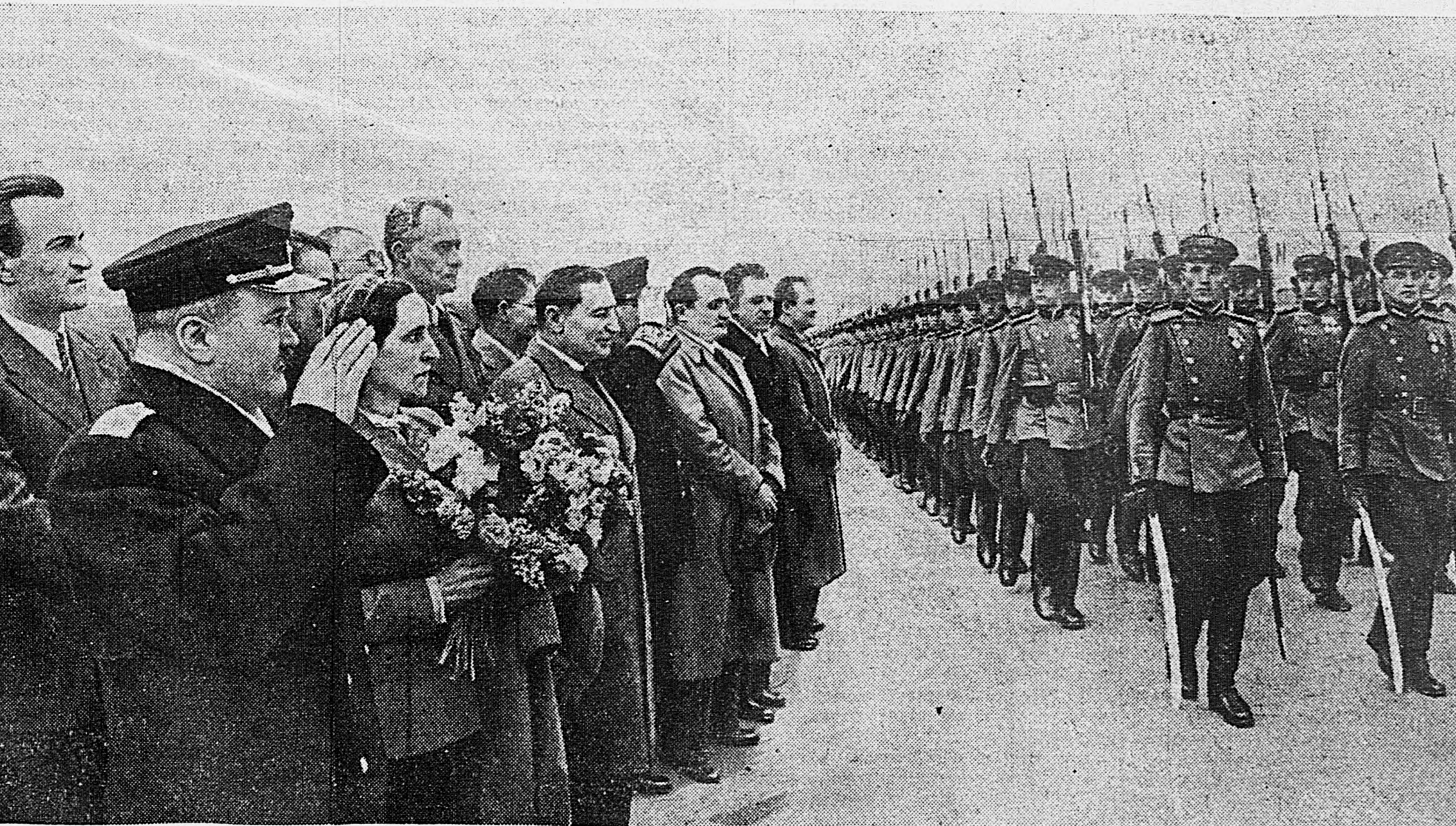
ПРИБЫТИЕ В МОСКВУ ПРЕМЬЕР-МИНИСТРА ЧЕХОСЛОВАЦКОЙ РЕСПУБЛИКИ Г-НА ЗД. ФИРЛИНГЕРА И ЧЛЕНОВ ЧЕХОСЛОВАЦКОГО ПРАВИТЕЛЬСТВА. В центральном аэродроме В. М. Молотов, г-н Зд. Фирлингер с супругой, генерал Л. Свобода, А. Я. Вышинский и другие наблюдают торжественный марш почетного караула.

Одновременно в Москву прибыл посол СССР в Чехословакии В. А. Зорин. На центральном аэродроме прибывших встречали заместитель Председателя Совета Народных Комиссаров и Народный Комиссар Иностранных Дел СССР В. М. Молотов, заместитель Народного Комиссара Иностранных Дел СССР А. Я. Вышинский, заместитель Народного Комиссара Внешней Торговли М. С. Степанов, заместитель