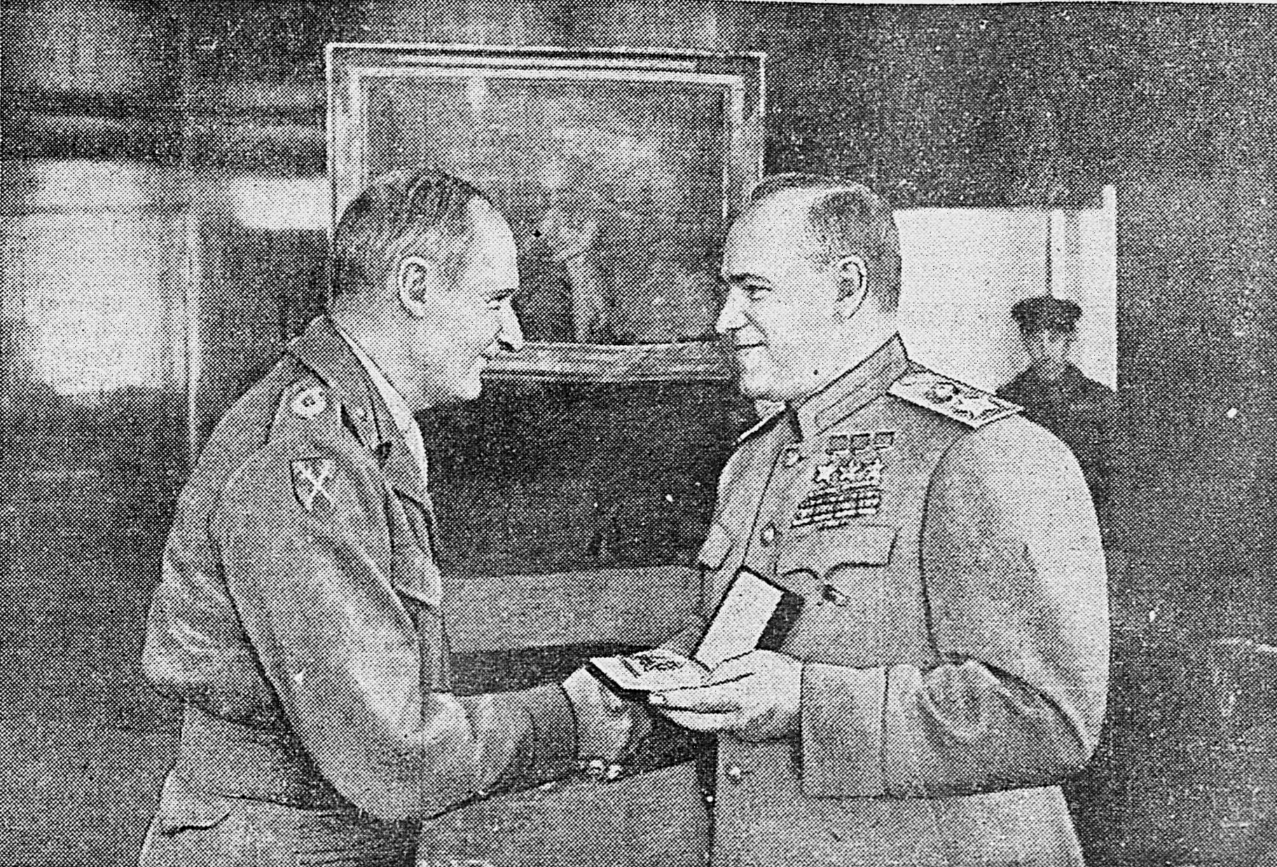
Маршал Г. К. Жуков вручает орден «Победа» генералу армии Эйзенхауэру и фельдмаршалу Монтоммери.