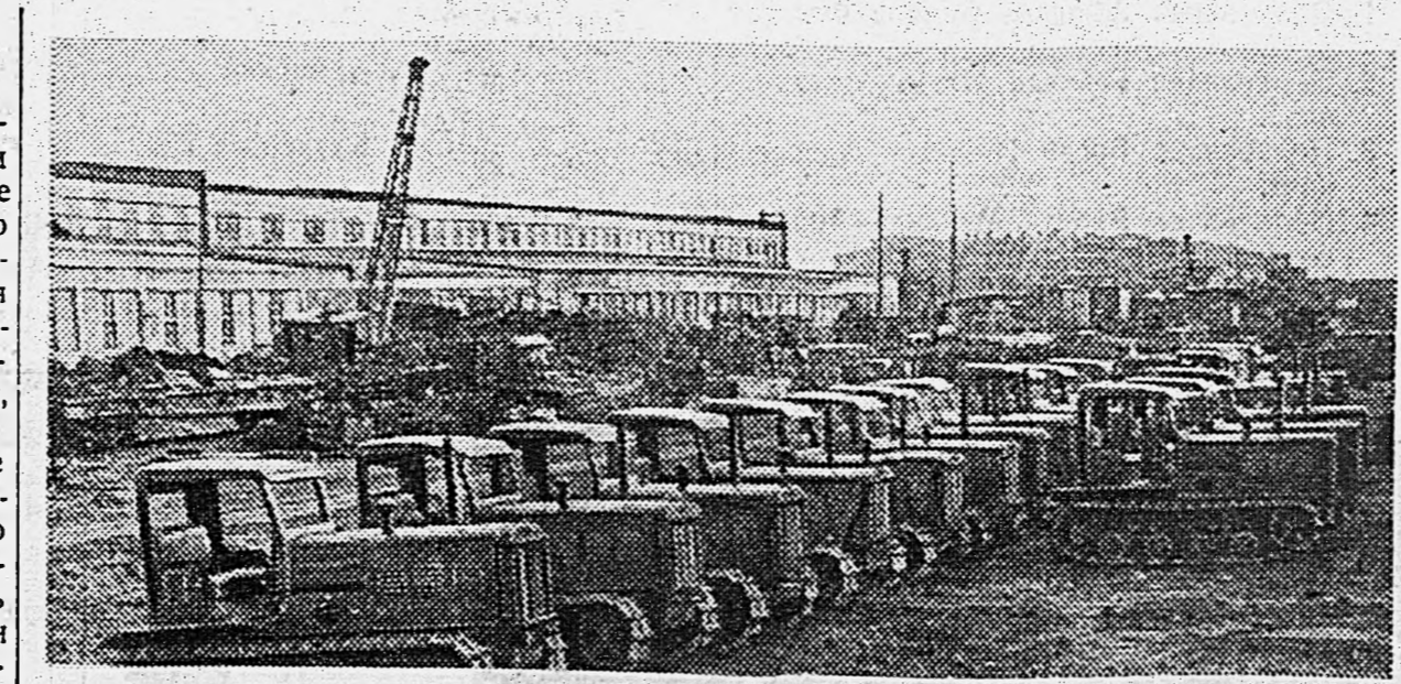
Сталинградский тракторный завод. Готовые тракторы на заводском дворе.

КИЕВ, 7 июня. (ТАСС). На юге Украины закончилась рожь и пшеница. МТС и колхозы активно готовятся к уборке урожая. Лохвицкая МТС — инициатор всесоюзного соревнования машинно-тракторных станций — накануне завершения ремонта комбайнов, молотилок и двигателей. О полной готовности комбайнов сообщают МТС им. «Правды», Гурьевская, Старобешевская и многие другие МТС. Дружно готовится к уборке передовые колхозы и МТС Каменец-Подольской области. Из ремонтных мастерских вышло много комбайнов, жаток и около 350 молотилок. Многие МТС послали в помощь колхозам ремонтные бригады слесарей и кузнецов, снабдили их необходимыми инструментами и материалами.