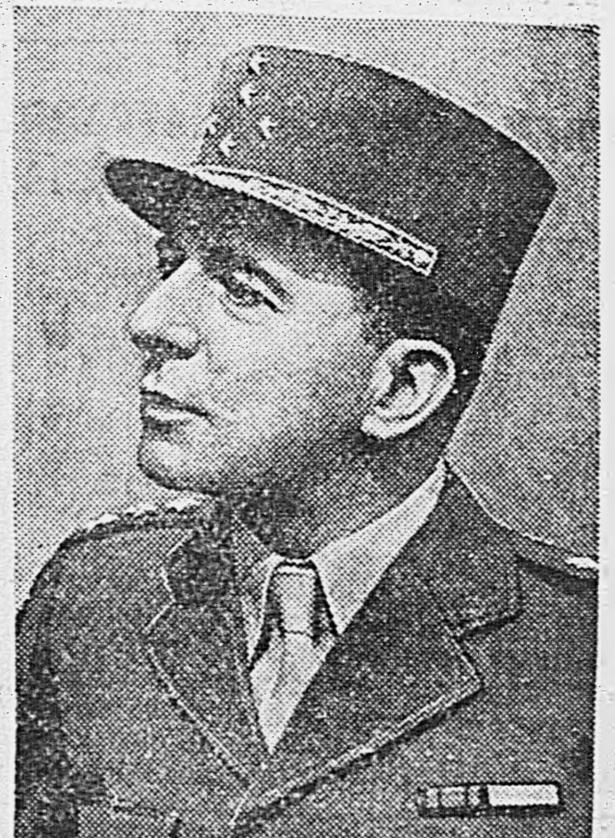
Генерал ДЕЛАТРУ де ТАССИНИ.