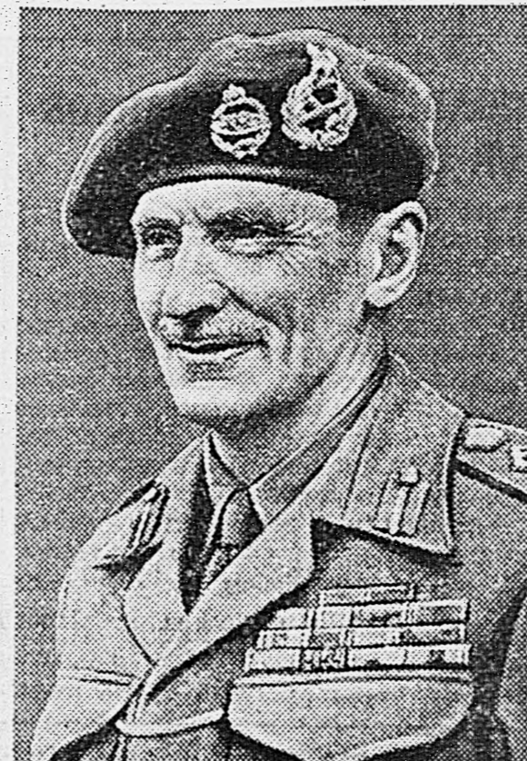
Фельдмаршал сэр Бернард Лоу МОНТГОМЕРИ.