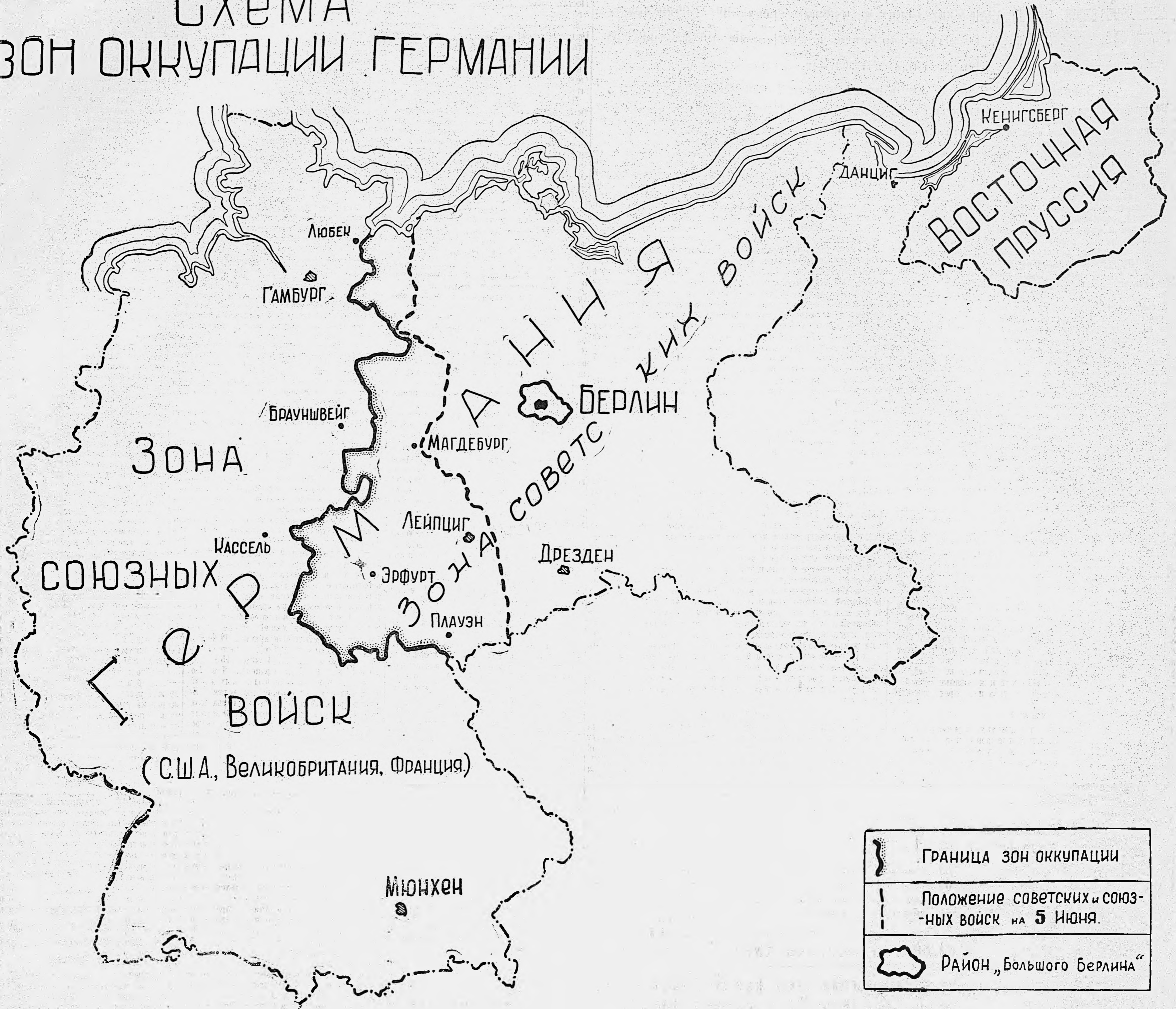
СХЕМА ЗОН ОККУПАЦИИ ГЕРМАНИИ