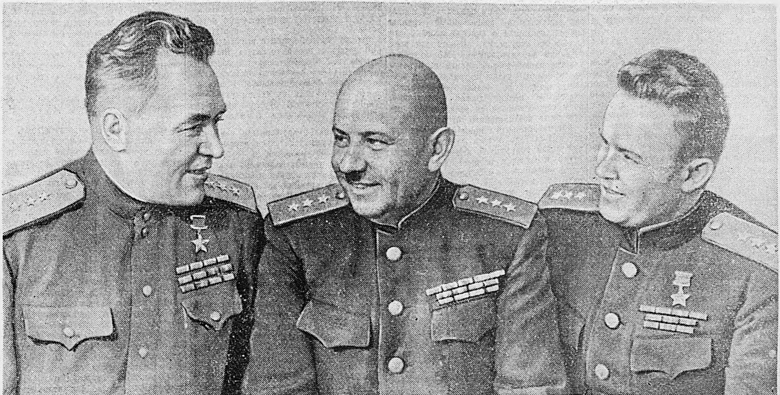
Герои Советского Союза генерал-подполковники авиации (слева направо): К. А. Вершинин, С. А. Красовский и С. И. Руденко.

Председатель Президиума Верховного Совета СССР М. КАЛИНИН. Секретарь Президиума Верховного Совета СССР А. ГОРКИН. Москва, Кремль. 29 мая 1945 г.