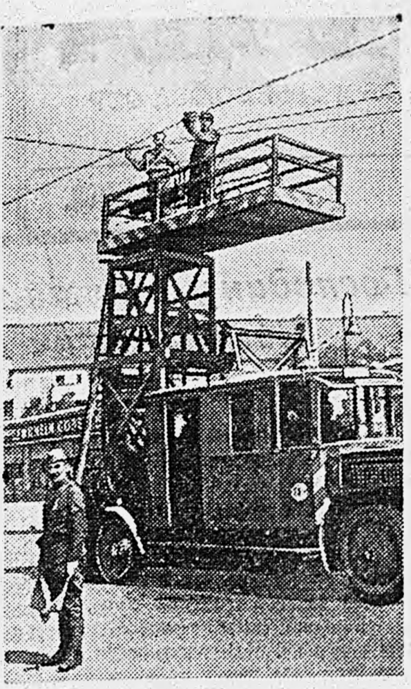
В БЕРЛИНЕ. Ремонт трамвайной электротрибы.