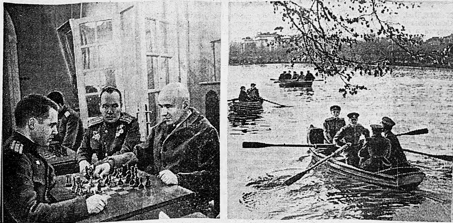
В выходной день в Центральном Доме Красной Армии. 1. В шахматном зале. 2. В парке ЦДКА.