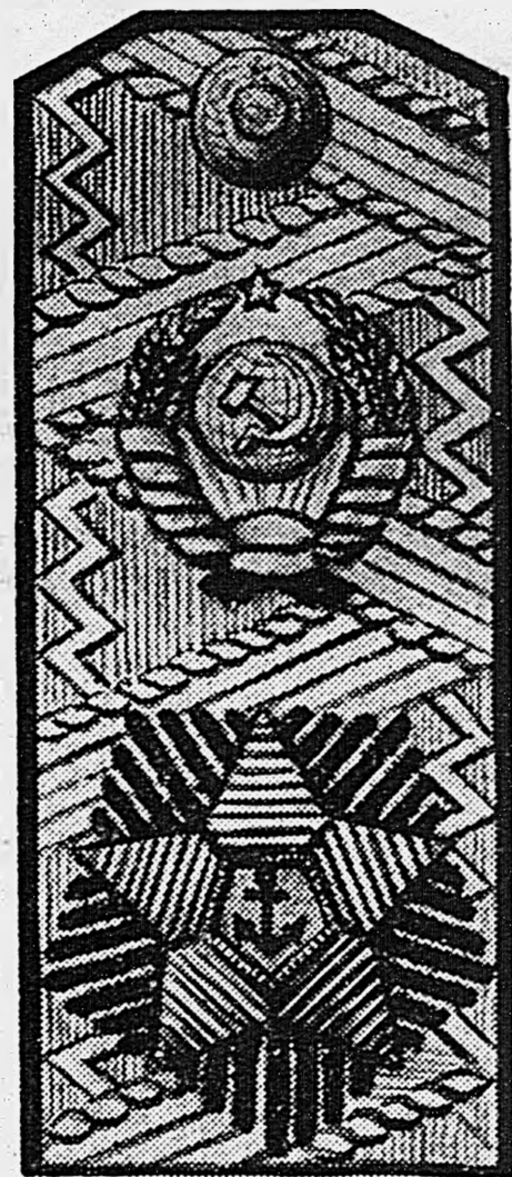
Погон адмирала флота.

Поле погона — из галуна особого переплетения установленного образца. В верхней части погона вышит герб Советского Союза, а ниже герба вышита золотая пятиконечная звезда размером 50 мм с выходящими из-под нее лучами черных лучей и с красным пятиконечным покрывалом, на котором черным шестиконечным вышит якорь.