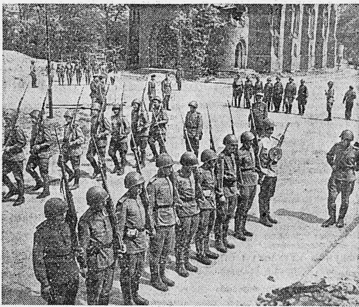
1-й БЕЛОРУССКИЙ ФРОНТ. Бойцы Н-ской части на строевых занятиях.