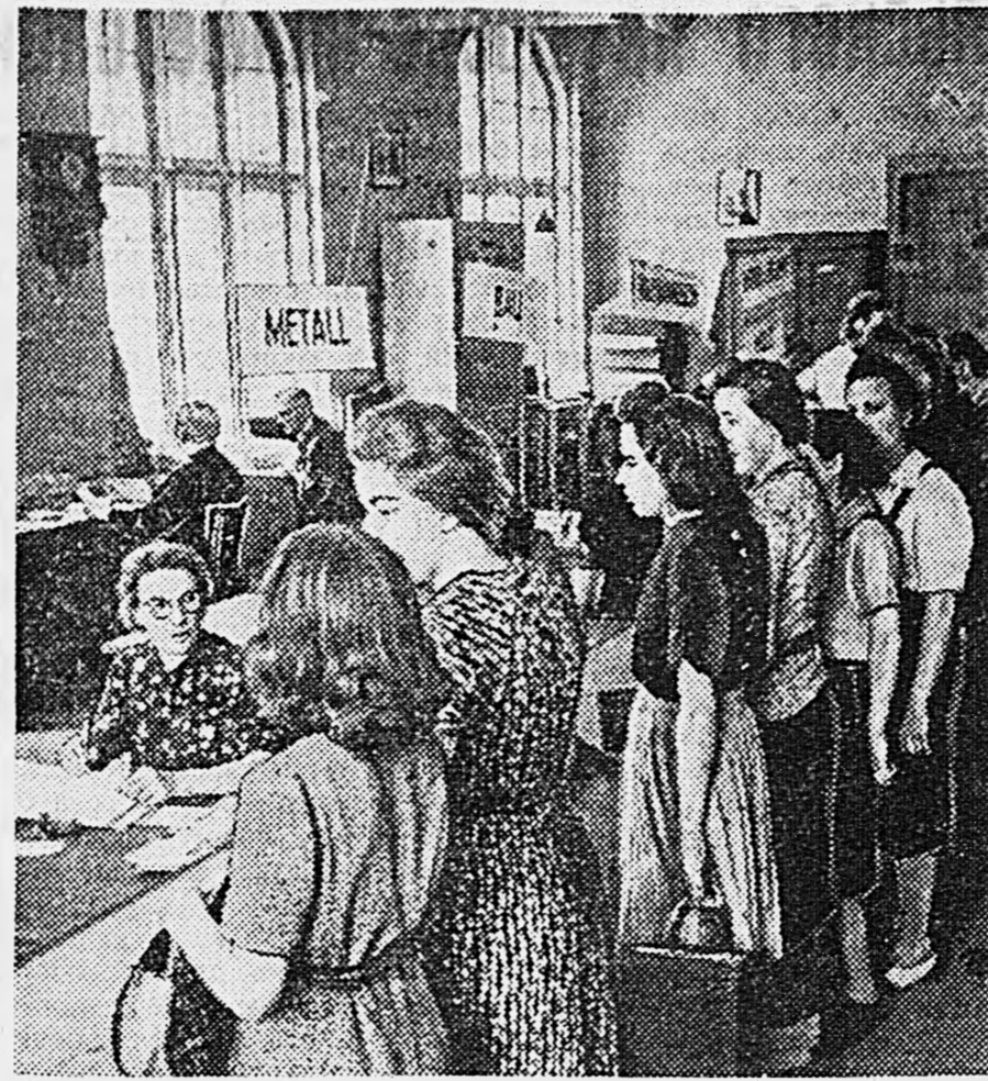
В БЕРЛИНЕ. 1. Биржа труда. 2. В одном из цехов возобновившей работу колбасной фабрики.

Красноармейский привет и поздравление успехов славной газете нашего героического ленинско-сталинского комсомола — «Комсомольской правды».