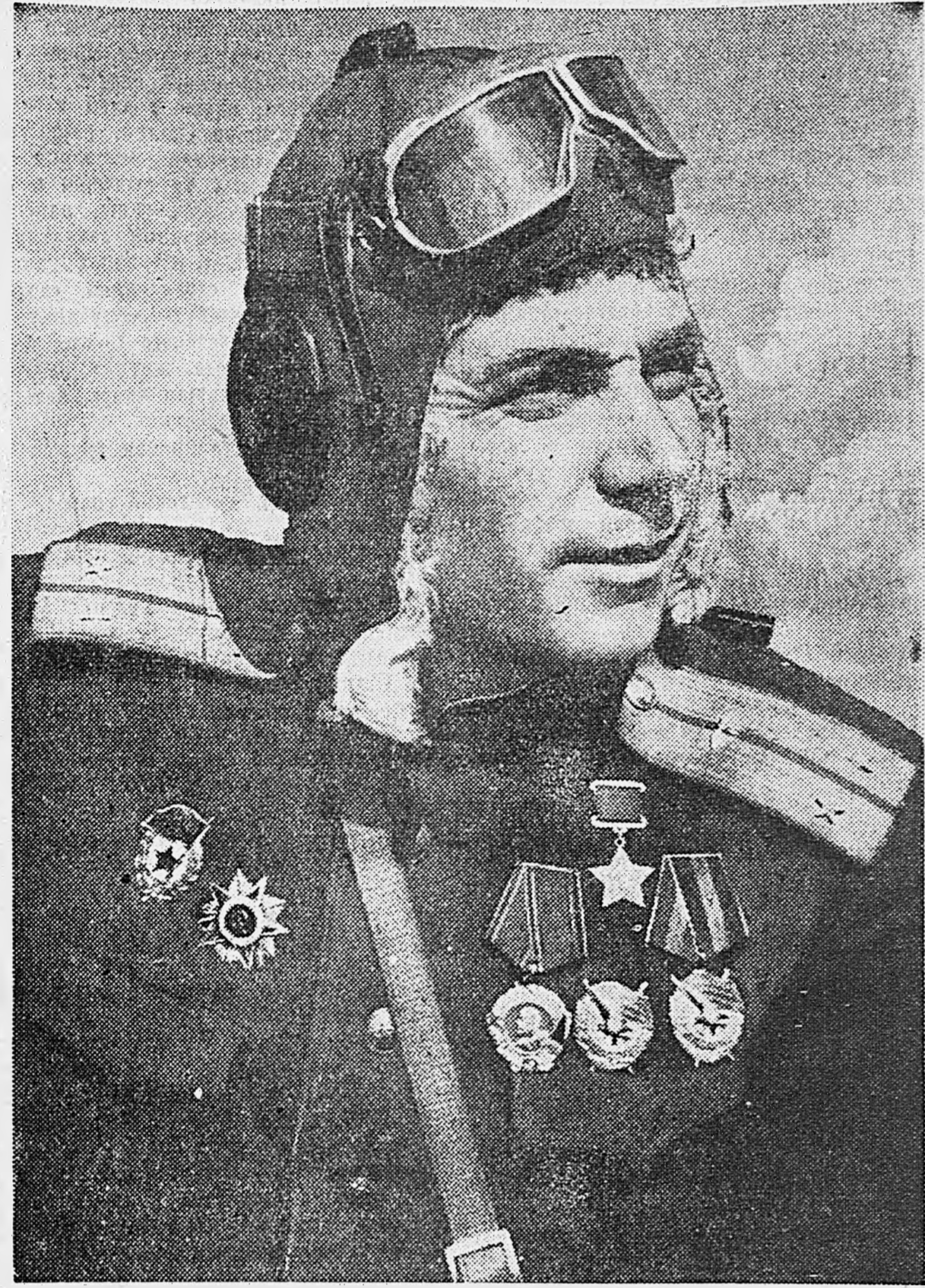
ГЕРОЙ СОВЕТСКОГО СОЮЗА ГВАРДИИ ЛЕЙТЕНАНТ М. ФИЛАТОВ.