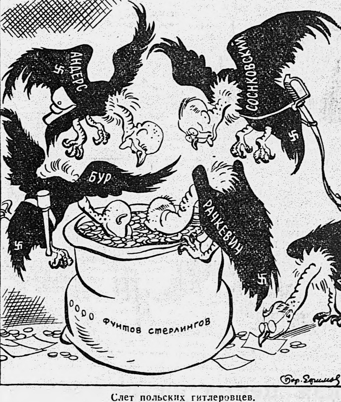
Слет польских гитлеровцев.

Лондонская газета «Сунс Кроуник» возмущается «разбазариванием крупных сумм английских денег на поддержку опасной группы фашистов-поляков в Лондоне».