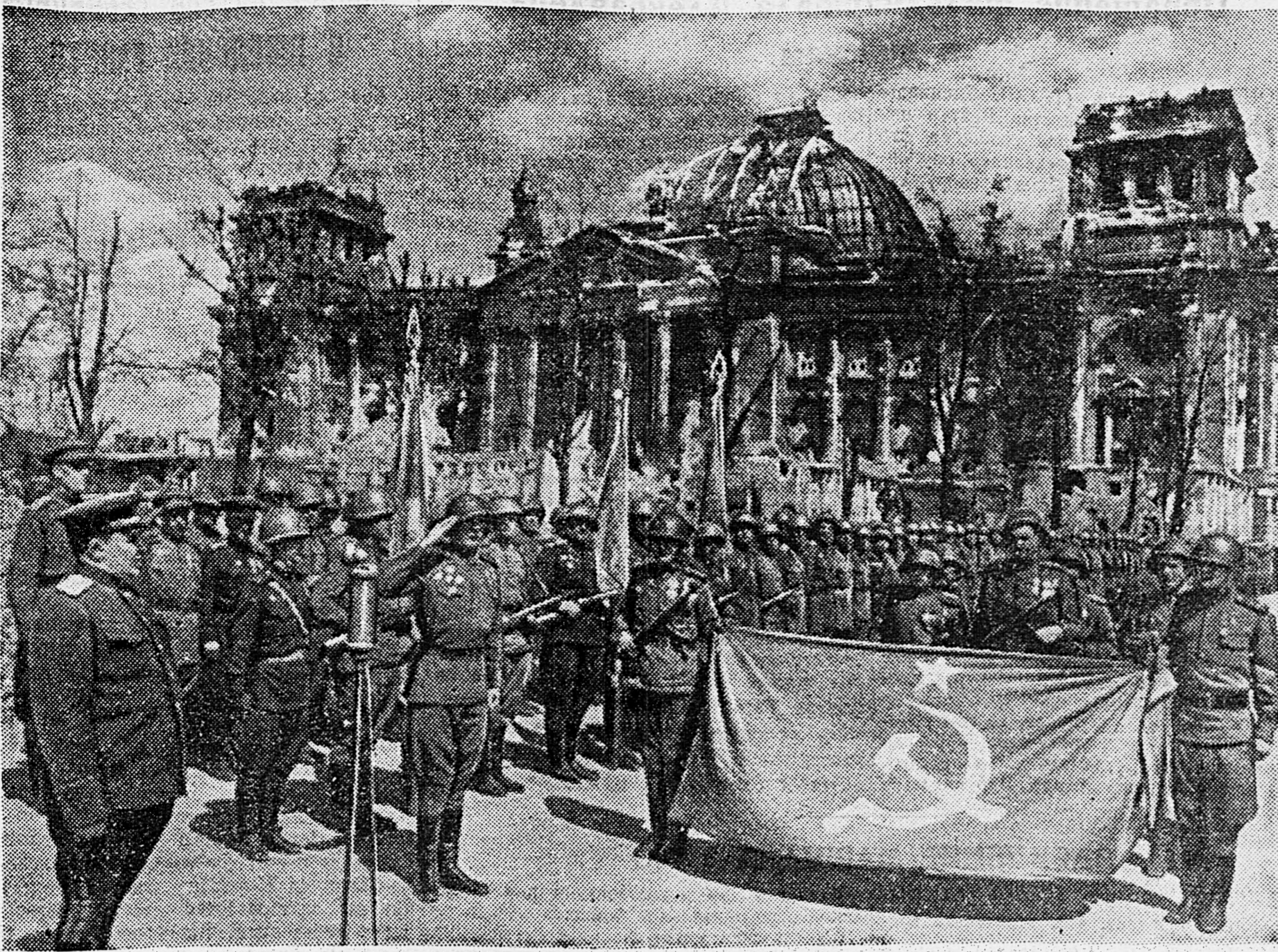
В БЕРЛИНЕ, У ЗДАНИЯ РЕЙХСТАГА. Торжественная передача Знамени победы для отправки в Москву. (См. корреспонденцию подполковника Л. Высокоостровского на 1-й странице). (Доставлен на самолете летчиком старшим лейтенантом Гарниер).