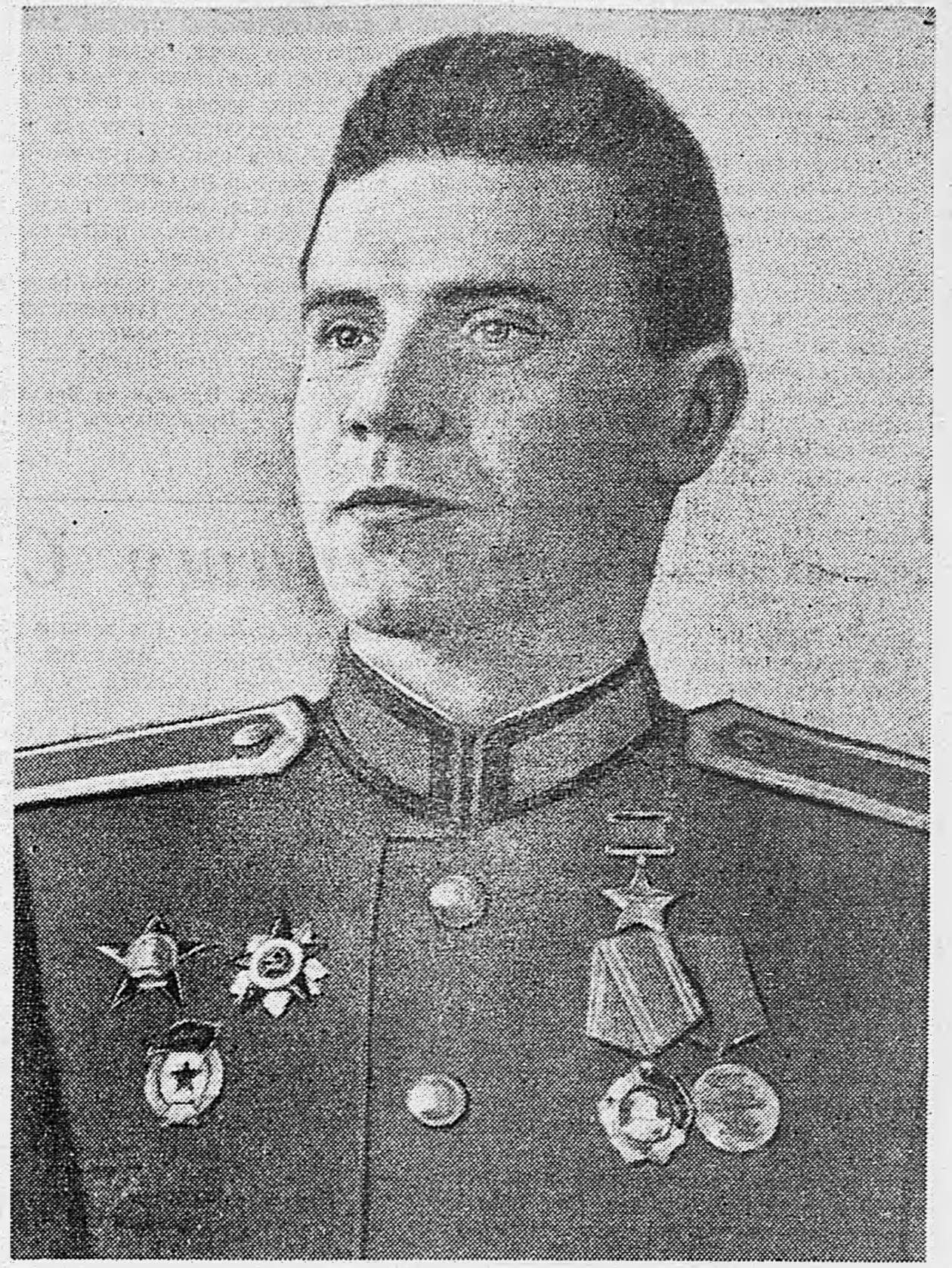
Снайпер Герой Советского Союза С. В. Петренко, уничтоживший за время Великой Отечественной войны около 500 немецких солдат и офицеров.

Ал. Сурков. — У самого синего моря. — 2. Нефтяная столица (3 стр.). Отчеты и выборы комсомольских органов. — Майор М. Сыров. — Хорошее собрание — результат хорошей подготовки (3 стр.).