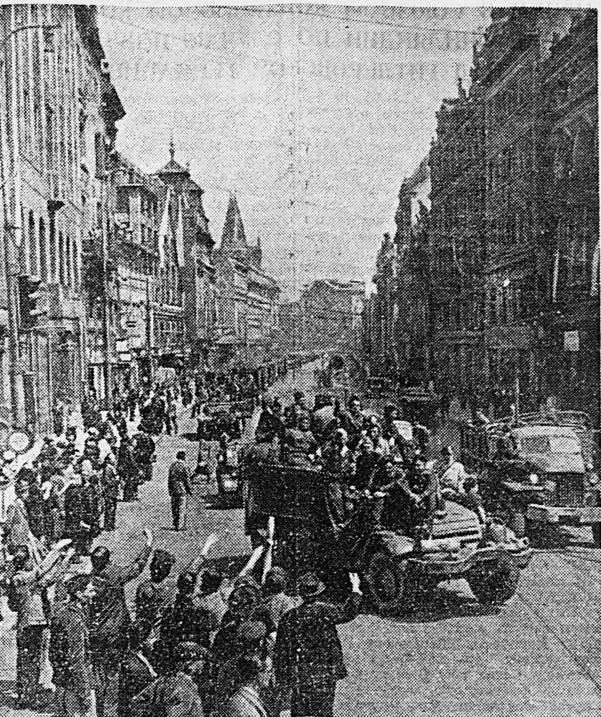
В ОСВОБОЖДЕННОЙ ПРАГЕ. Население столицы Чехословакии приветствует освободителей — воинов Красной Армии.

Старший лейтенант М. НАРБЕВИЧ. ПРАГА, 19 мая. (По телеграфу).