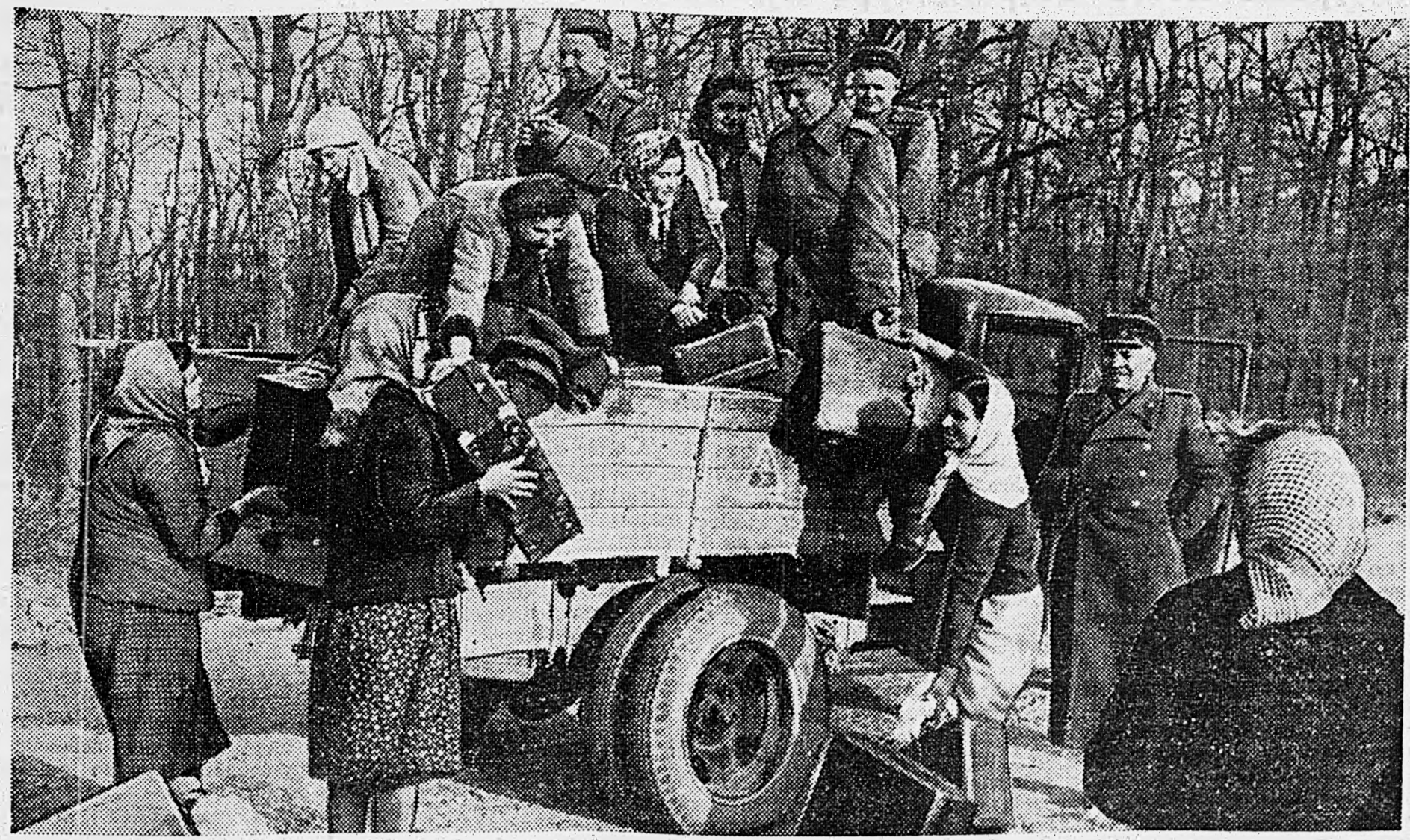
Кончилась рабство! Советские женщины, освобожденные Красной Армией из немецкой неволи, возвращаются на родину.