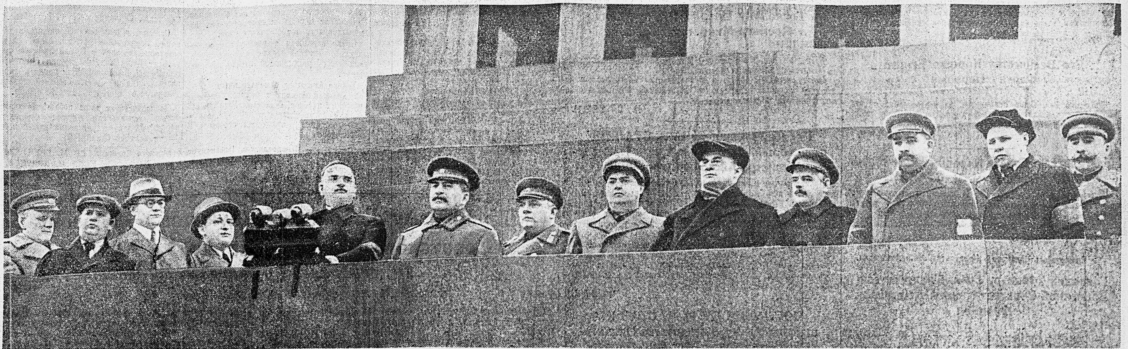
ПОХОРОНЫ СЕКРЕТАРЯ ЦЕНТРАЛЬНОГО И МОСКОВСКОГО КОМИТЕТОВ ВКП(б), НАЧАЛЬНИКА ГЛАВНОГО ПОЛИТИЧЕСКОГО УПРАВЛЕНИЯ КРАСНОЙ АРМИИ А. С. ШЕРБАКОВА. На трибуне мавзолея во время траурного митинга. Слева направо: товарищи Ф. И. ГОЛИКОВ, Г. М. ПОПОВ, А. Ф. ГОРКИН, Г. Ф. АЛЕКСАНДРОВ, Н. М. ШВЕРНИК, И. В. СТАЛИН, К. Е. ВОРОШИЛОВ, Г. М. МАЛЕНКОВ, Л. П. БЕРИЯ, А. А. АНДРЕЕВ, Л. М. КАГАНОВИЧ, Н. А. ВОЗНЕСЕНСКИЙ, С. М. БУДЕННЫЙ.