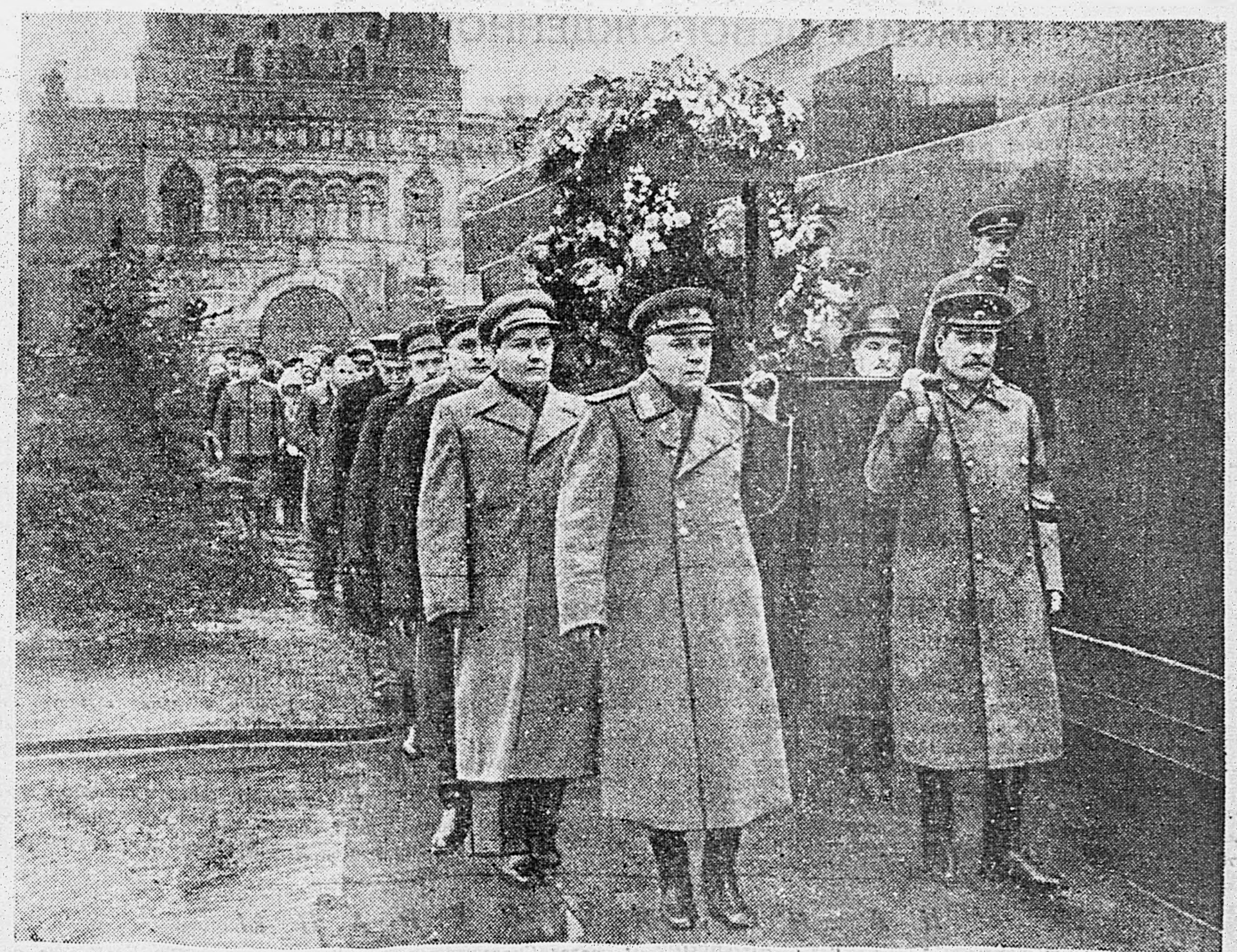
ПОХОРОНЫ СЕКРЕТАРЯ ЦЕНТРАЛЬНОГО И МОСКОВСКОГО КОМИТЕТОВ ВКП(б), НАЧАЛЬНИКА ГЛАВНОГО ПОЛИТИЧЕСКОГО УПРАВЛЕНИЯ КРАСНОЙ АРМИИ А. С. ШЕРБАКОВА. На снимке: товарищи И. В. СТАЛИН, К. Е. ВОРОШИЛОВ, Г. М. МАЛЕНКОВ, Л. П. БЕРИЯ, А. А. АНДРЕЕВ, Н. М. ШВЕРНИК и другие направляются с урной к Кремлевской стене.

Всего, таким образом, с 9 по 12 мая на всех фронтах взято в плен более 700.000 немецких солдат и офицеров, 63 генерала, считая и группу немецких солдат и офицеров, окончивших сдачу 11 мая войскам 3-го БЕЛОРУССКОГО фронта.