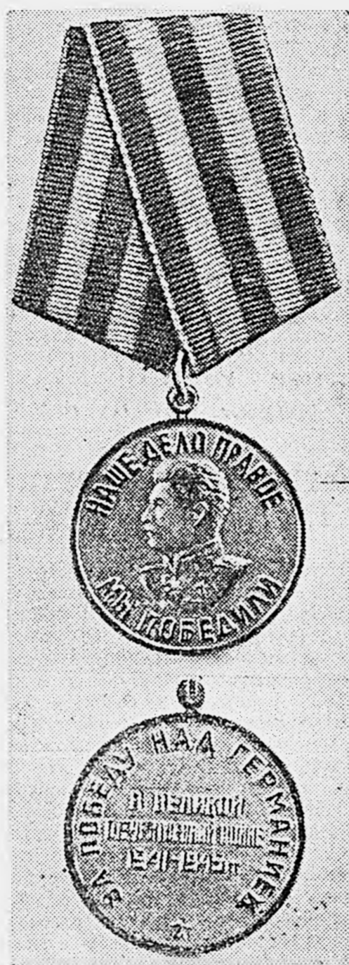
Медаль «За победу над Германией в Великой Отечественной войне 1941—1945 гг.»