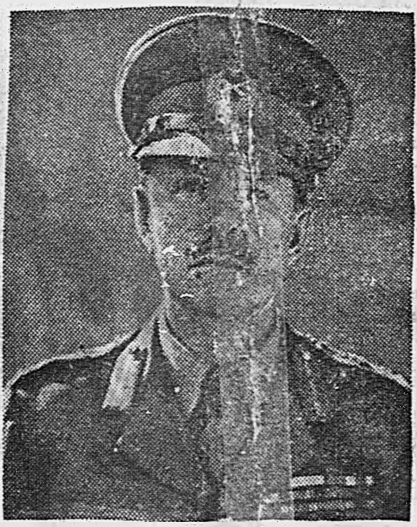
Верховный Главнокомандующий силами союзников на средиземноморском театре фельдмаршал Гарольд АЛЕКСАНДЕР