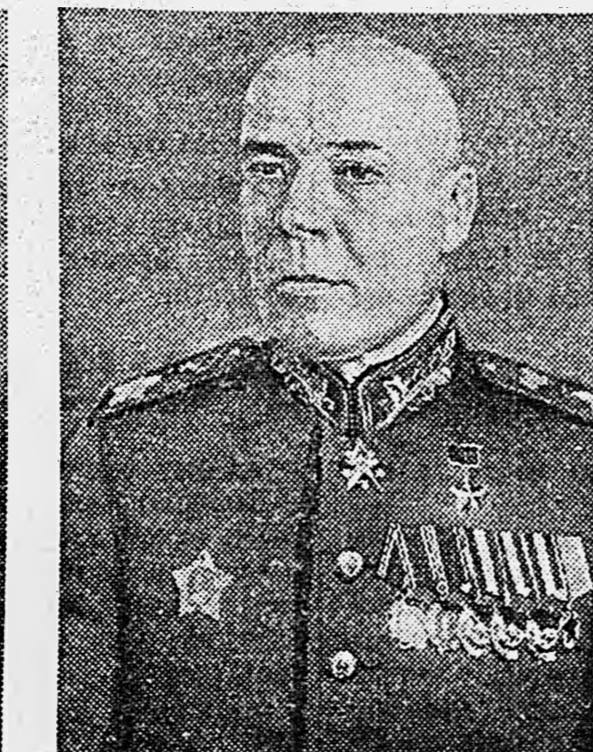
Маршал Советского Союза С. К. ТИМОШЕНКО