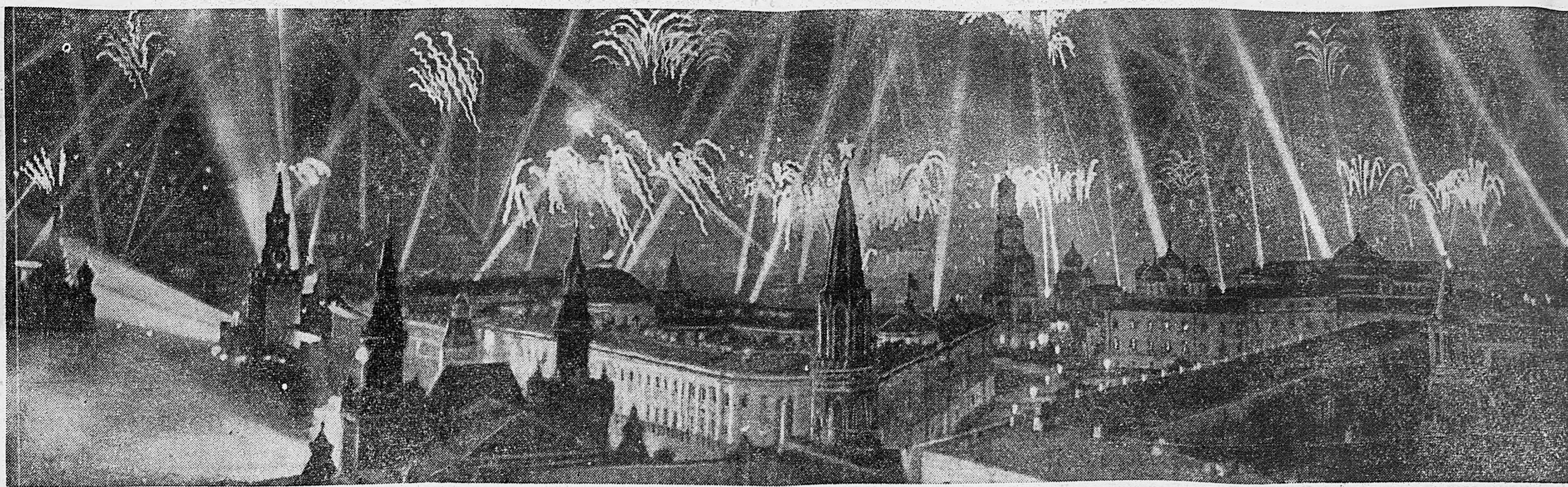
ПРАЗДНИК ПОБЕДЫ. Москва в 22 часа 9 мая.