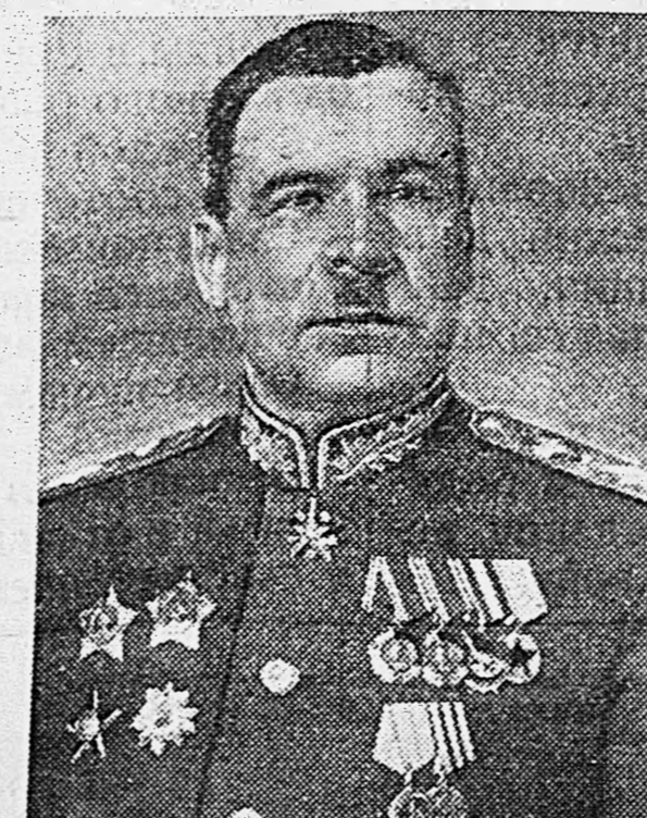
Маршал Советского Союза Л. А. ГОВОРОВ