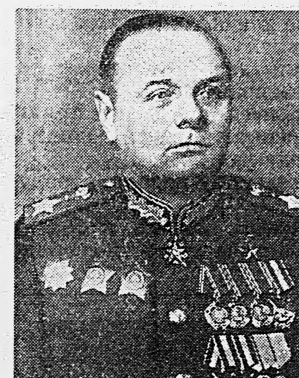
Маршал Советского Союза К. А. МЕРЕЦКОВ