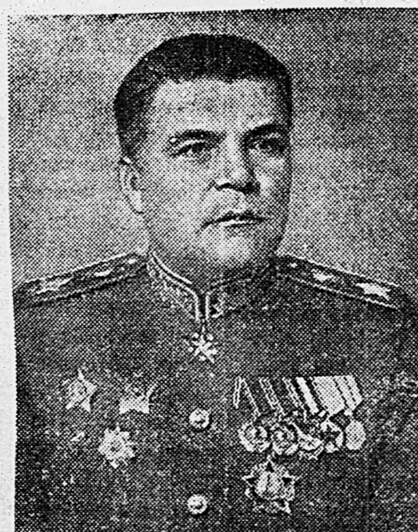
Маршал Советского Союза Р. Я. МАЛИНОВСКИЙ