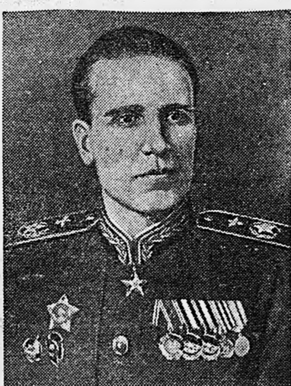
Главный маршал авиации А. Е. ГОЛОВАНОВ