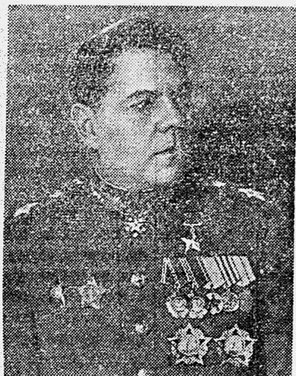
Маршал Советского Союза А. М. ВАСИЛЕВСКИЙ