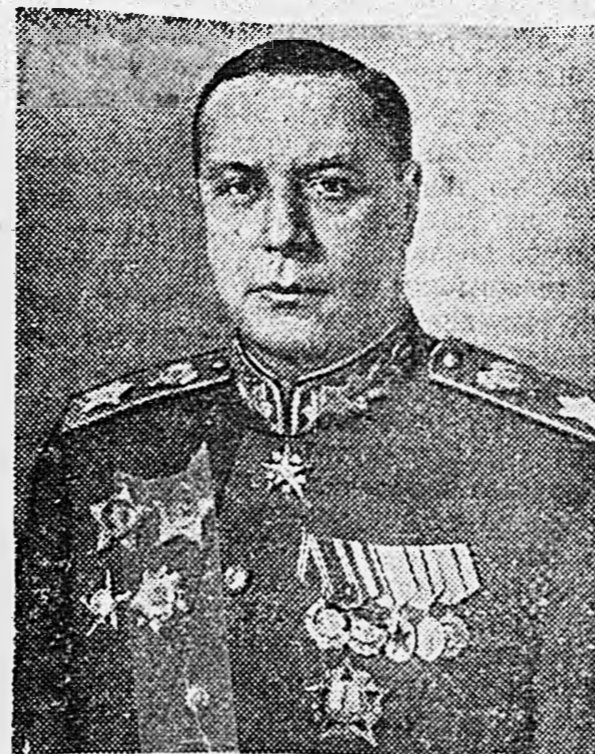
Маршал Советского Союза Ф. И. ТОЛБУХИН