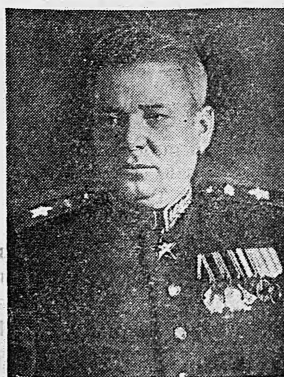
Маршал бронетанковых войск Я. Н. ФЕДОРЕНКО