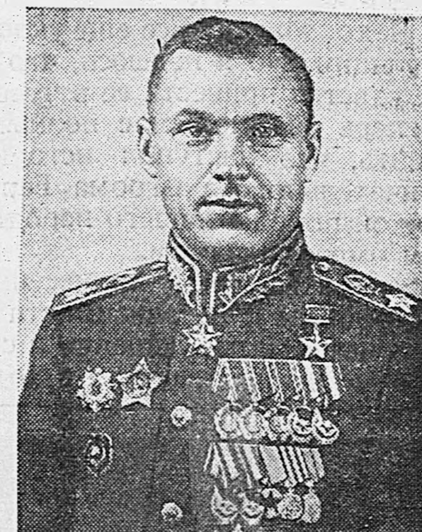
Маршал Советского Союза К. К. ОССОВСКИЙ