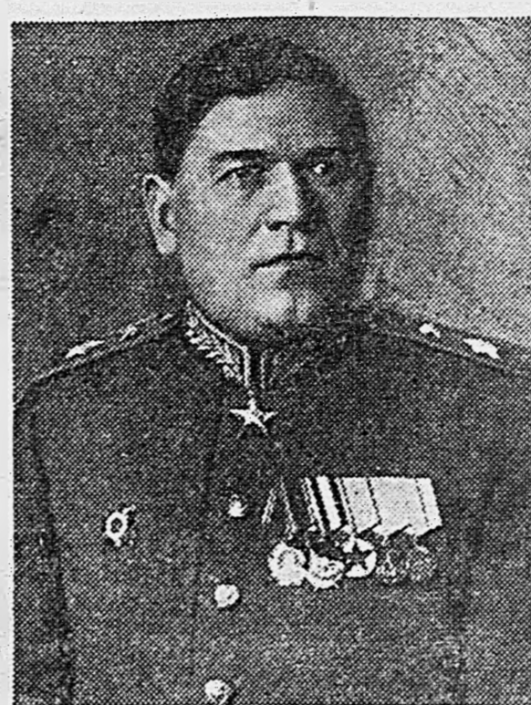
Маршал инженерных войск М. П. ВОРОБЬЕВ