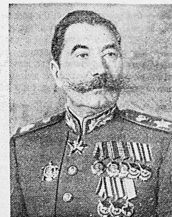
Маршал Советского Союза С. М. БУДЕННЫЙ