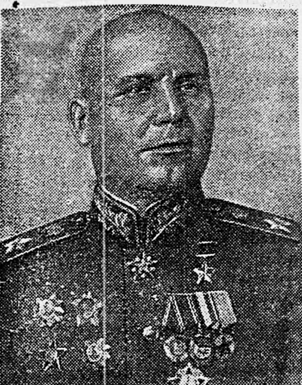
Маршал Советского Союза Н. С. КОНЕВ