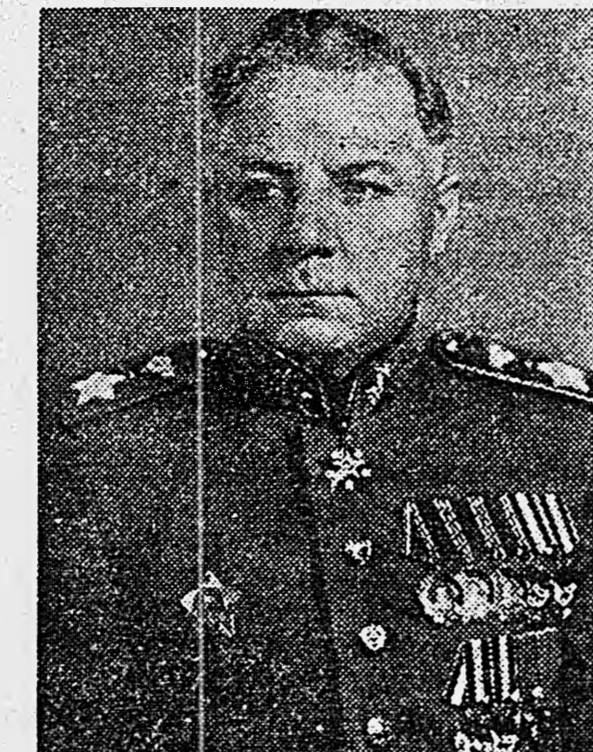
Маршал Советского Союза К. Е. ВОРОШИЛОВ