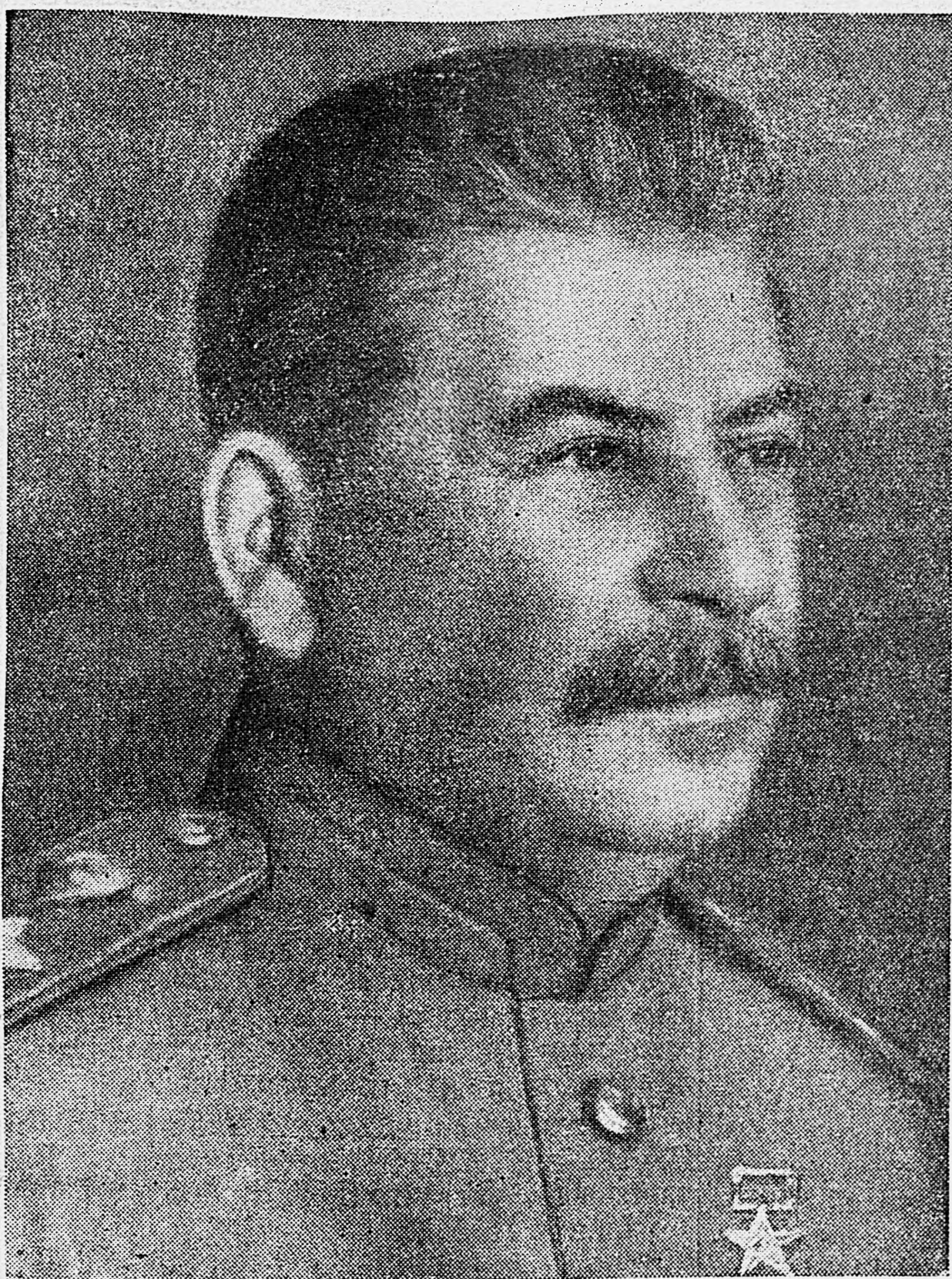
М. В. СТАЛИН