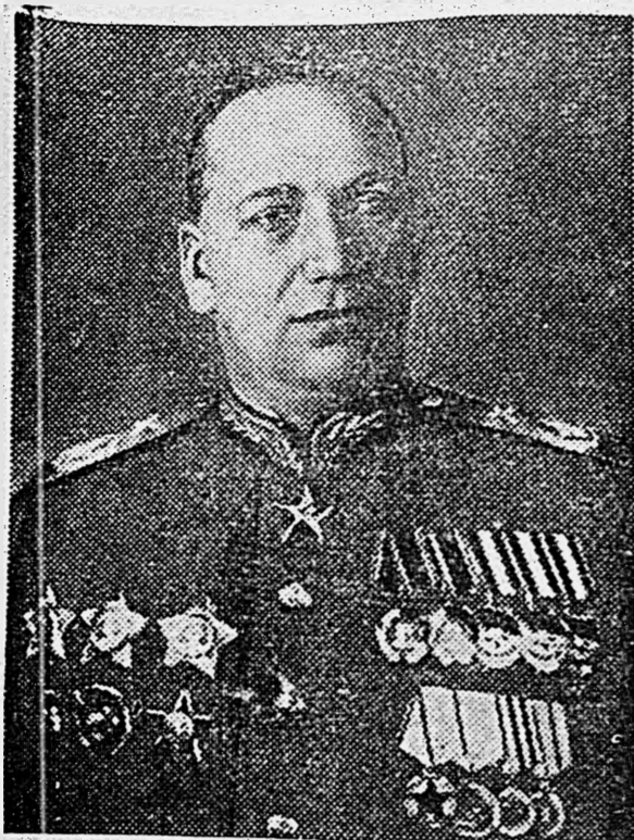
Главный маршал артиллерии Н. Н. БОРОВОВ