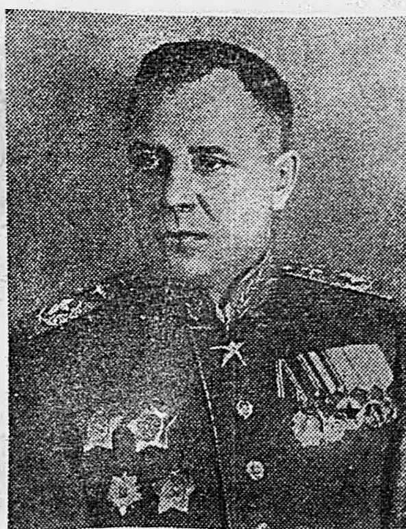
Главный маршал авиации А. А. НОВИКОВ