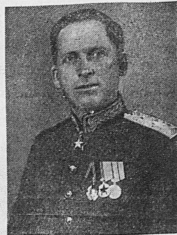
Маршал войск связи И. Т. ПЕРЫШЕВ