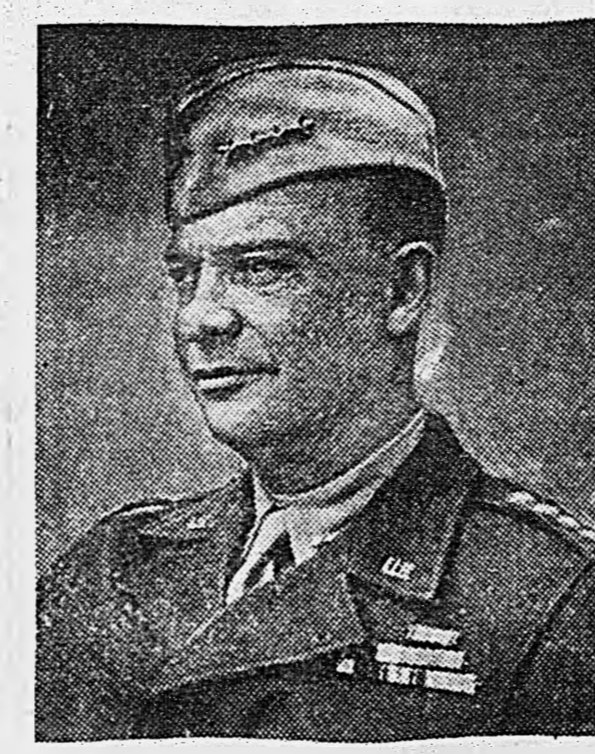
Верховный Главнокомандующий экспедиционными силами союзников генерал армии Дуайт ЭЙЗЕНХАУЭР