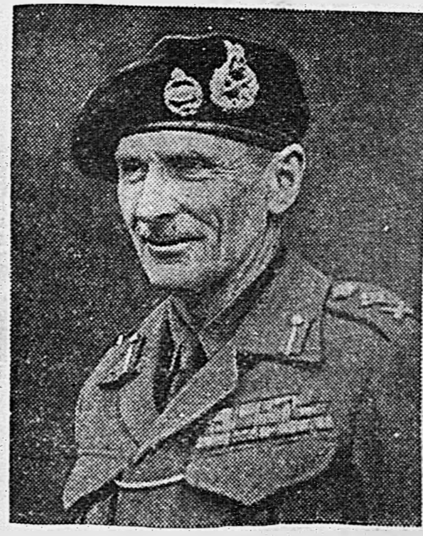
Командующий 21-й армейской группой фельдмаршал Бернард МОНТГОМЕРИ