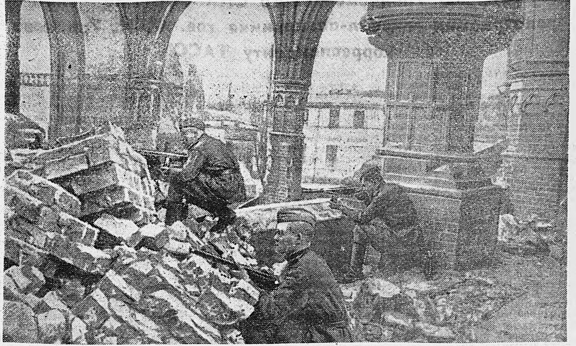
ВЧЕРА В БЕРЛИНЕ. Советские воины продолжали громить врага в центре германской столицы. (Доставлен на самолете летчиком старшим лейтенантом Савченко).