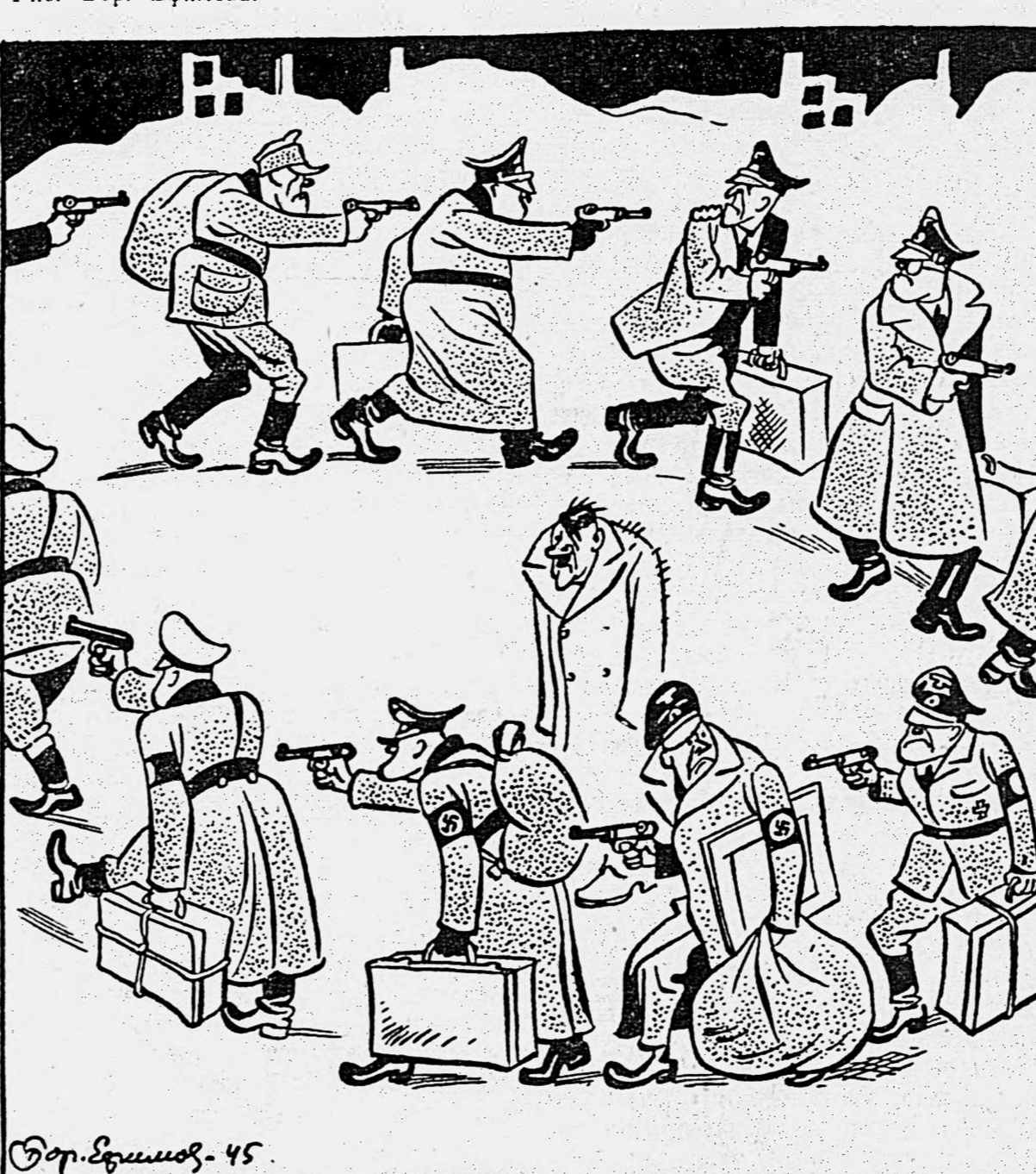
Сильное оживление среди гитлеровских гаулейтеров.

Гитлеровское руководство чрезвычайно встревожено огромным ростом дезертирства и ленинских настроений. Гитлер требует расстреливать виновных на месте «независимо от их ранга».