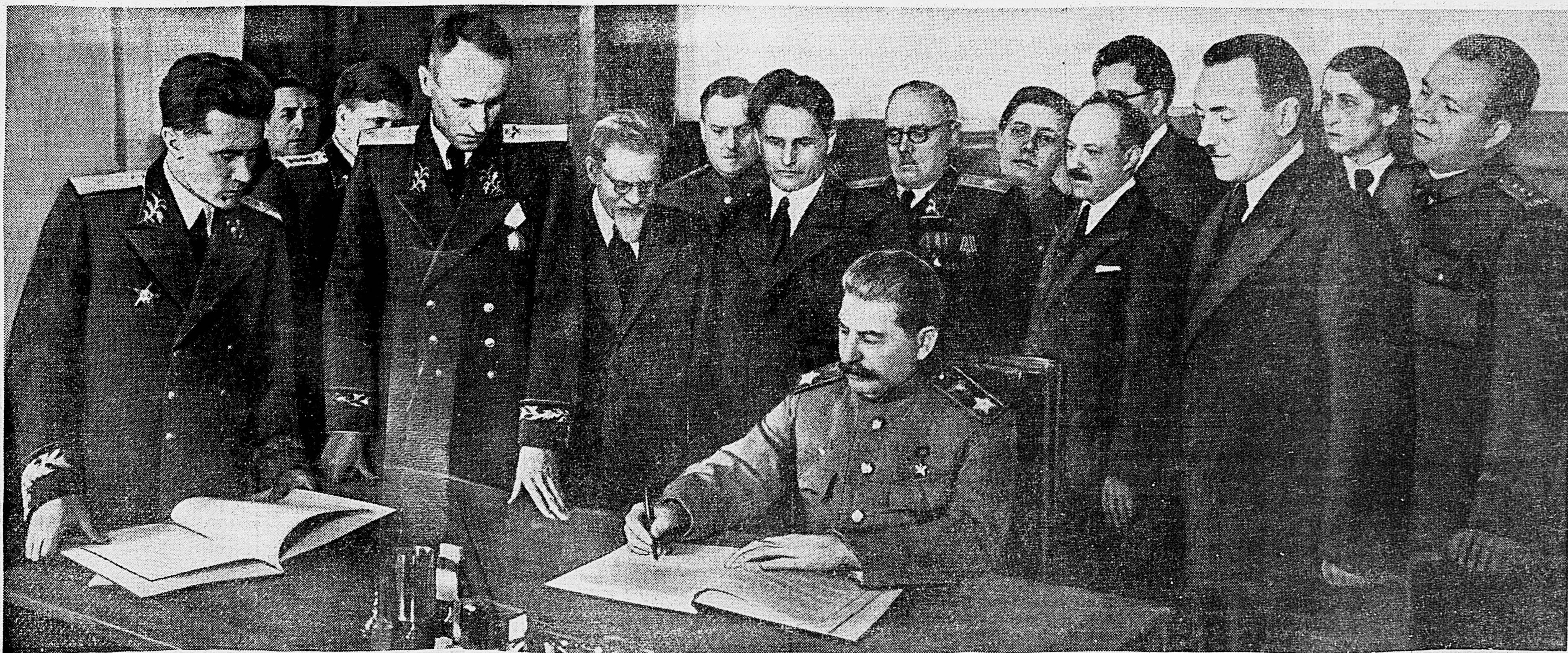
ПОДПИСАНИЕ ДОГОВОРА О ДРУЖБЕ, ВЗАИМНОЙ ПОМОЩИ И ПОСЛЕВОЕННОМ СОТРУДНИЧЕСТВЕ МЕЖДУ СОВЕТСКИМ СОЮЗОМ И ПОЛЬСКОЙ РЕСПУБЛИКОЙ. Подписывает договор И. В. Сталин. На снимке: М. И. Калинин, Н. А. Булагин, А. Я. Вышинский, В. З. Лебедев, г-н Берут, г-н Э. Осубка-Моравский, генерал-полковник М. Роля-Жимерский, г-н Э. Модзелевский, В. Василевская и другие.

Речь г. Осубка-Моравского при подписании Договора — на 2-й стр.