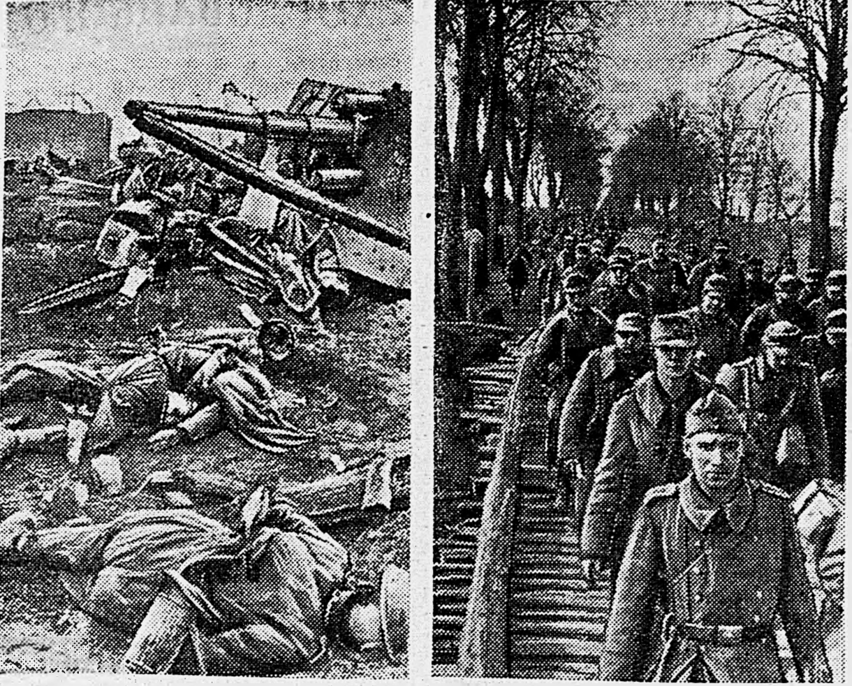
В РАЙОНЕ КЕНИГСБЕРГА. 1. Вражескими трупами и техникой усеяно поле боя. 2. В тылу движется вереницы немецких военнопленных.

После полудня мы приехали в Вальд. Этот живописный город и курорт с обшир-