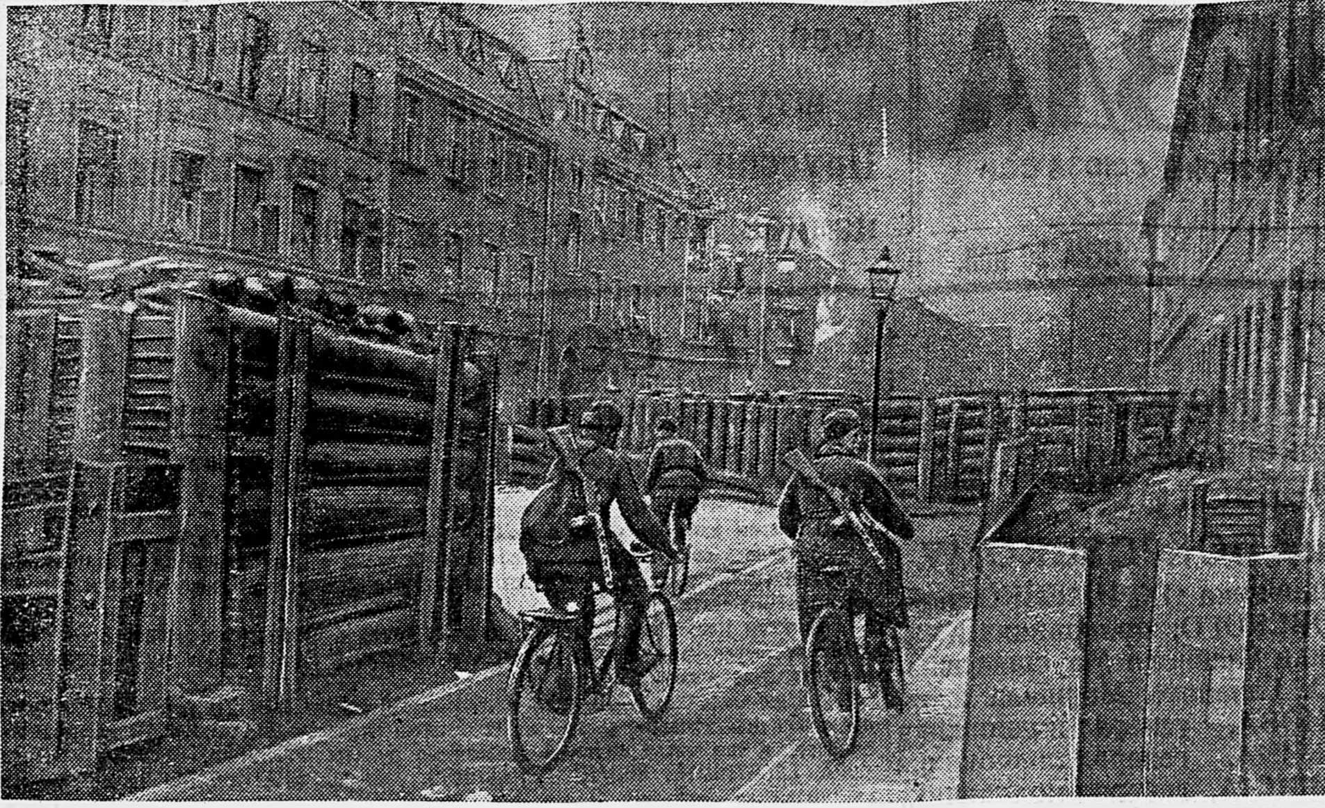
В РАЙОНЕ КЕНИГСБЕРГА. 1. Взорванный форт. 2. Укрепления на одной из улиц города.