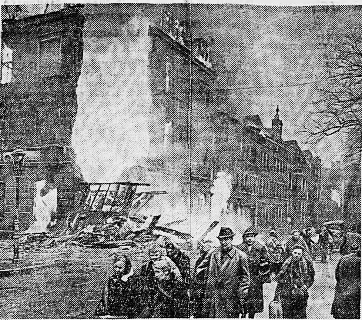
ГДАНЬСК. На одной из улиц в день освобождения города от немецких захватчиков.

На имя командира ежедневно поступают ответные письма, в которых родные горячо благодарят командование за внимание.