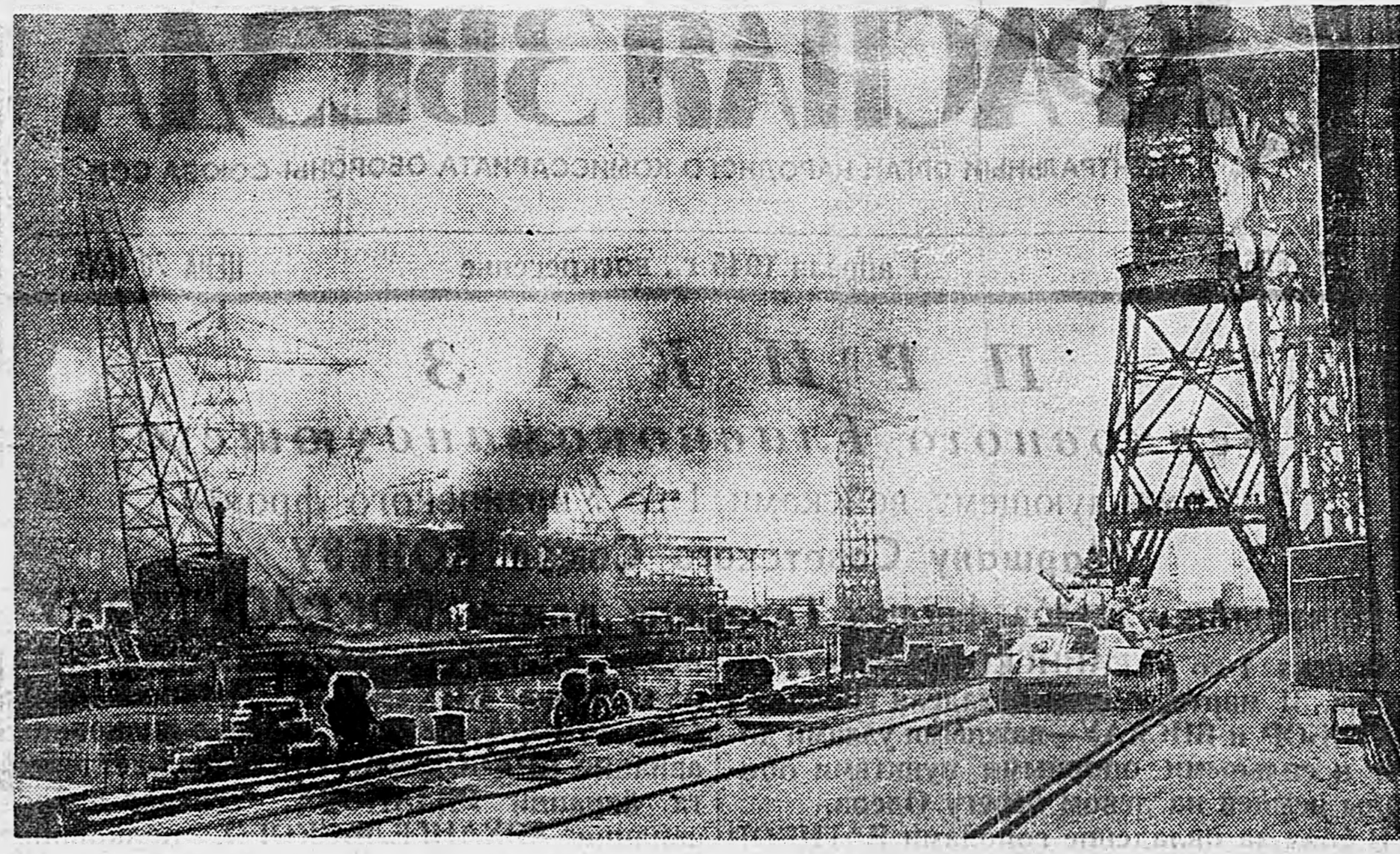
ГДАНЬСК. В порту.

Рассмотрев итоги Всесоюзного социалистического соревнования областей, краев и республик за выполнение планов ремонта тракторов и сельскохозяйственных машин, Совет Народных Комиссаров Союза ССР призвал победителей в социалистическом соревновании следующие области и республики и постановил: Вручить переходящие Красные Знамена Государственного Комитета Обороны и выдать установленные денежные премии: а) за лучшее выполнение планов осенне-зимнего ремонта — Белорусской ССР Сталинской области Украинской ССР Днепротроветровской области Украинской ССР; б) за выполнение планов ремонта в феврале — Ивановской области Брянской области. Отметить положительную работу следующих областей и республик, выполнивших планы ремонта тракторов: Азербайджанскую ССР, Армянскую ССР, Грузинскую ССР, Дагестанскую АССР, Кировоградскую, Николаевскую, Одесскую и Ворошиловградскую области Украинской ССР, Карагандинскую область Казахской ССР, Ленинградскую область Таджикской ССР, Киргизскую ССР, Карело-Финскую ССР, Архангельскую, Великолукскую, Вологодскую, Горьковскую, Кировскую, Костромскую, Ленинградскую, Свердловскую, Челябинскую и Ярославскую области, Коми и Якутскую АССР и Якут-