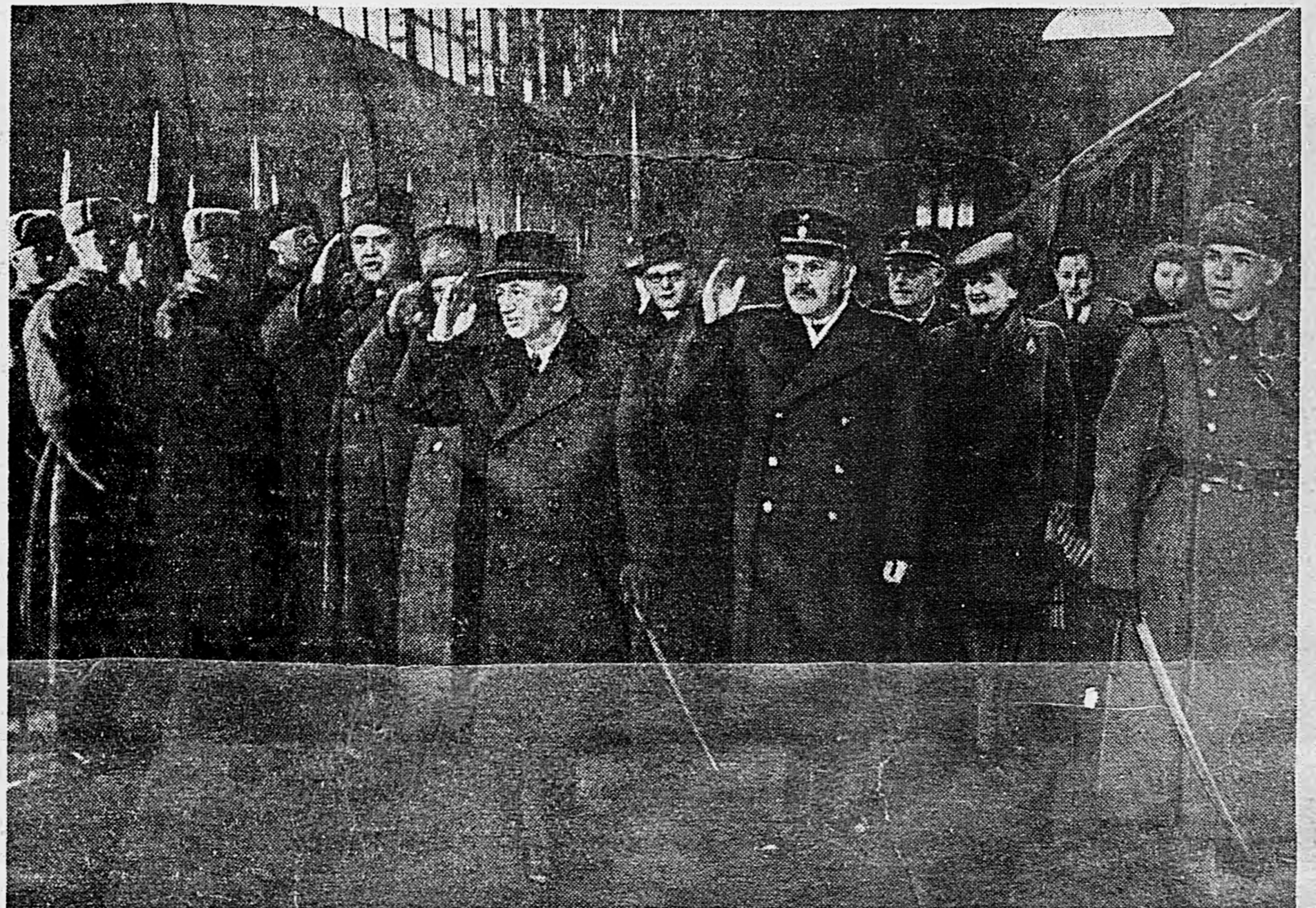
Отъезд из Москвы Президента Чехословацкой Республики г-на Эдуарда Бенеша. На снимке: В. М. Молотов, г-н Эд. Бенеш и другие обходят фронт о караула

При прощании выстроен почетный караул и были исполнены государственные гимны Чехословакии и Советского Союза. Вокзал был украшен чехословацкими и советскими флагами.