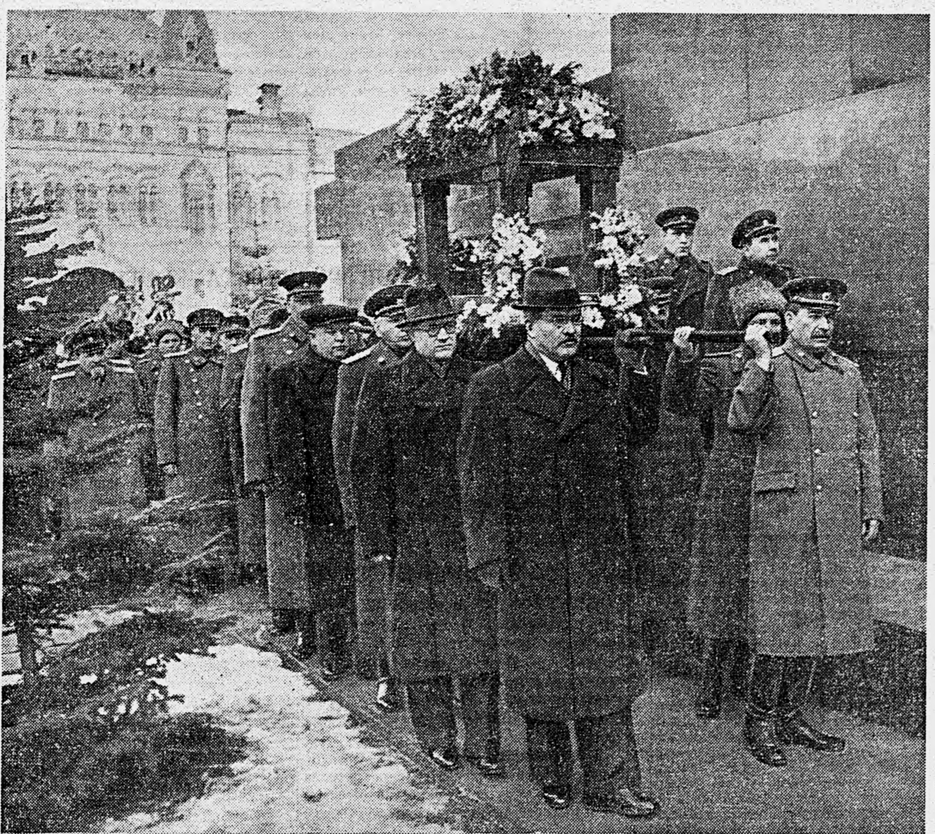
Похороны Маршала Советского Союза Б. М. Шапошникова. Впереди траурного шествия, направляющегося с урной к Кремлевской стене, товарищи И. В. Сталин и В. М. Молотов.