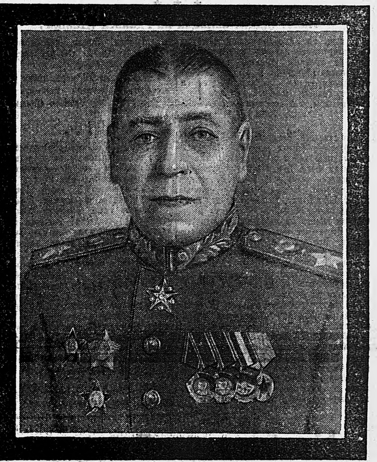
Шапошников Б. М.

Память Маршала Советского Союза Шапошникова Б. М. увековечивается сооружением ему памятника в городе Москве.