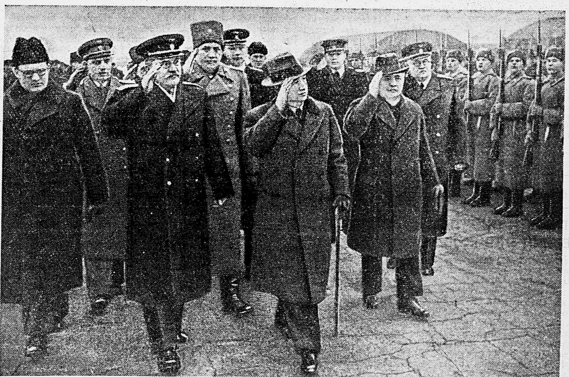
Прибытие в Москву Президента Чехословацкой Республики г-на Эдуарда Бенеша и Премьер-Министра Чехословацкой Республики г-на Я. Шрамека. На снимке: В. М. Молотов, г-н Эд. Бенеш, г-н Я. Шрамека на центральном аэродроме.

Москву. Это подтверждает еще большее значение нашей общей дружбы и наших союзнических отношений. Я уверен, что скоро враг будет разбит и Европа — опять свободна».