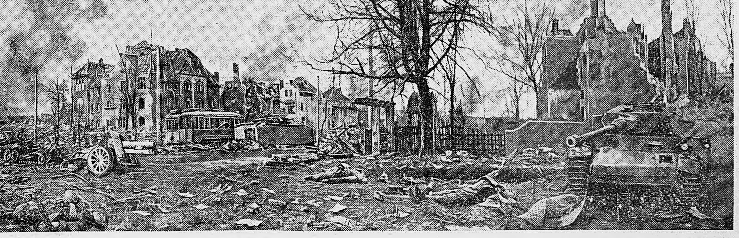
В БРЕСЛАУ. Здесь был бой.

Из государственного бюджета и в порядке кредита через Сельскохозяйственный банк выделены средства на строительство оросительных сооружений и проектно-испытательные работы. В этих расходах примут участие также колхозы, совхозы и наркоматы, чьи подсобные хозяйства находятся в этих зонах. На промышленных предприятиях и в артелях промышленной кооперации организуются производство и ремонт водоподъемных и дождевальных установок, запасных частей к ним и инвентаря. (ТАСС).