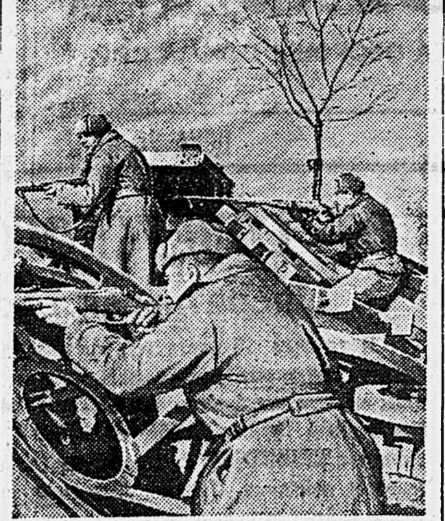
В РАЙОНЕ БРЕСЛАВ. Захватив немецкую баррикаду, бойцы обстреливают гитлеровцев.