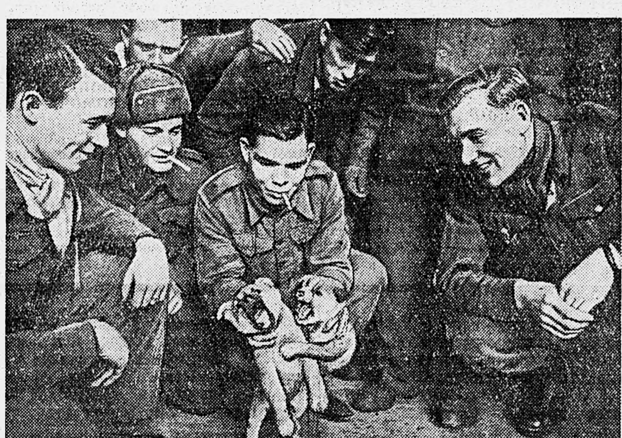
В ОДЕССКОМ ПОРТУ. Английские, американские и французские солдаты и офицеры, освобожденные Красной Армией из немецкого плена, отправляются на родину. На нижнем снимке: в ожидании посадки; сверху — посадка на теплоход.

лихорадочно, радость, и певцы пришлось повторить свою арию. В коридоре, в комнатах люди свистят и смеются так громко, что мне непонятно, как они слышат друг друга — они давно не смеялись. Я вхожу в одну из комнат, куда набилось человек 40. Здесь, кроме смеха, раздаются еще какие-то странные звуки: это джаз-банд без инструментов. Молодежь гоголюбовазый американец изумительно подражает саксофону, другой выбивает на консервной банке барабанный бой, третий держит две крышки, выкалывающие на кухне, и изображает оркестровые тарелки. Слушатели свистят и стучат ногами. На стене американский флаг: его подарили в Польшу. В комнату заходит русский врач, он спрашивает, не нужна ли здесь его помощь. Все смеются в ответ: — Мы давно так хорошо себя не чувствовали. В соседней комнате такие же веселые молодые лица. Солдаты обступили перелегочку и заспаяют его просящими и вопросами: «Знают ли нам красную звездочку, как у вас на шапке. Нам необходимо привезти такую звездочку в Америку, на память. Некоторым из нас уже подарили на фронте». В саду гуляют двое: англичанин и француз. Они странно жестикулируют и, увидев переводчицу, просят его помочь им поговорить. Она они попали в плен в Дюнкерке. Француз, сангатор, три раза пробовал бежать из лагерей и за это сидит в тюрьме. Англичанин, родом из