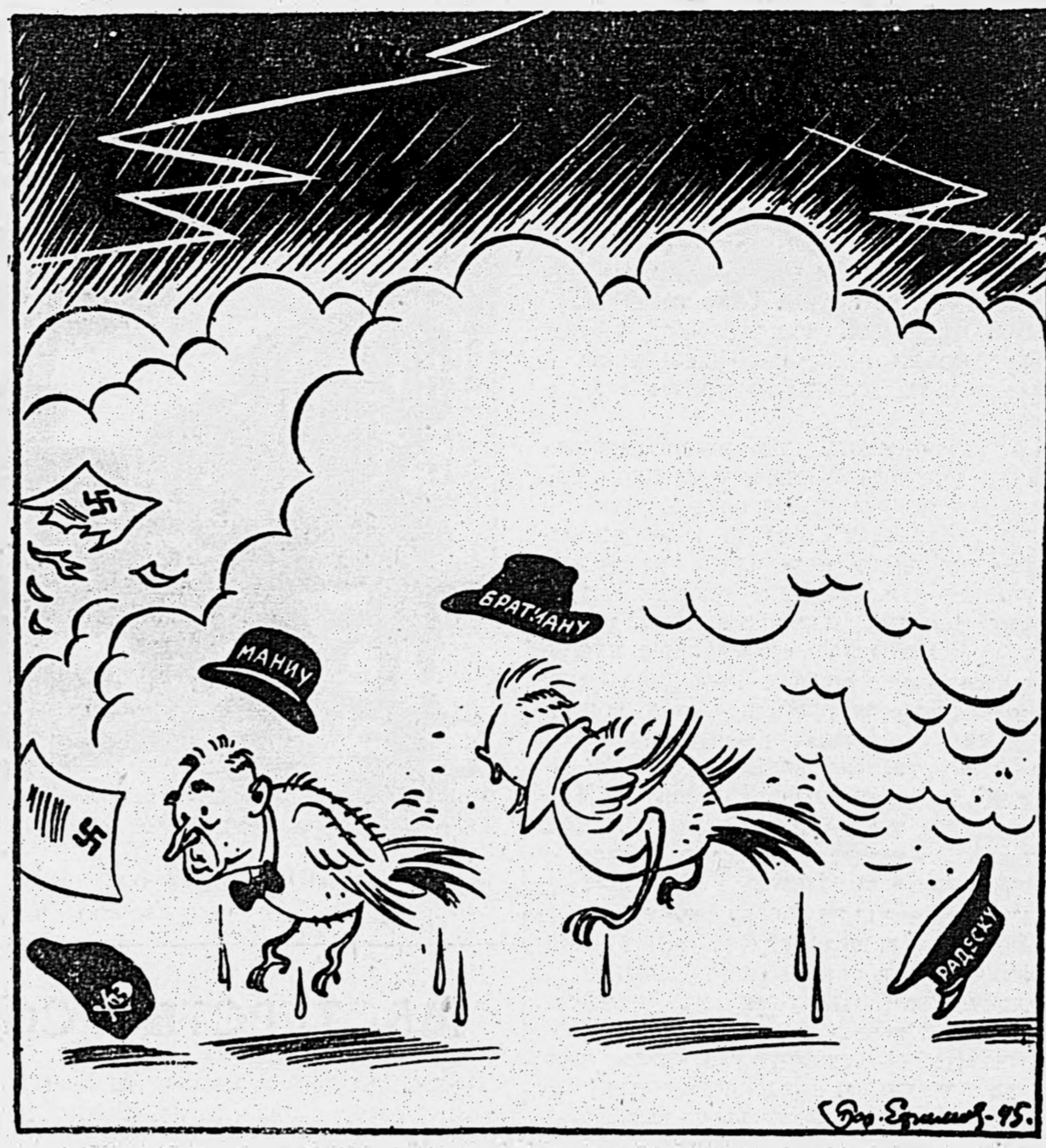
Свежий демократический ветер в Румынии.