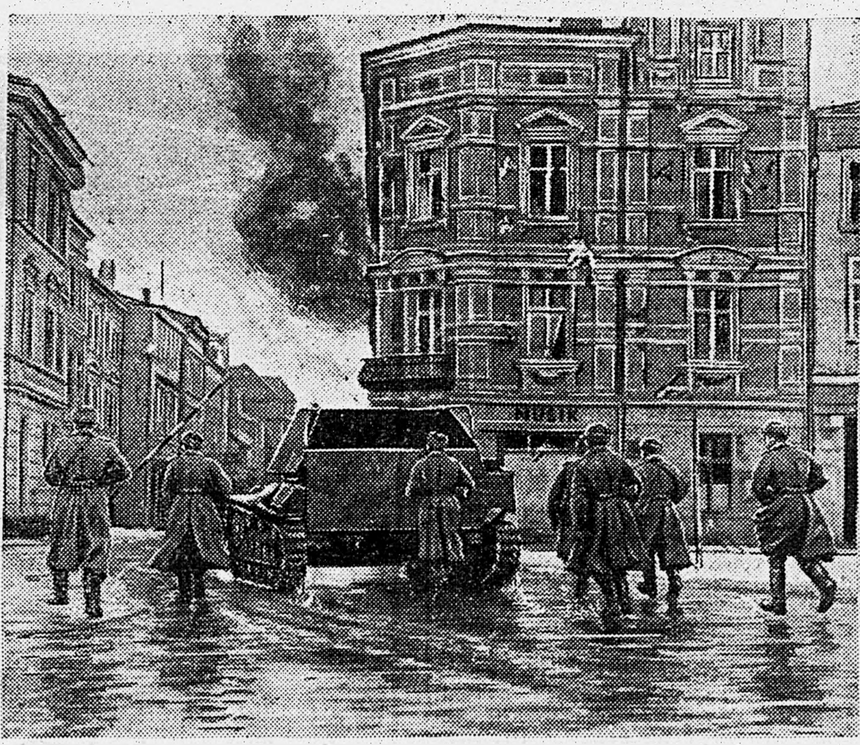
В ПОМЕРАНИИ. Автоматчики при поддержке артсамохода ведут уличный бой.