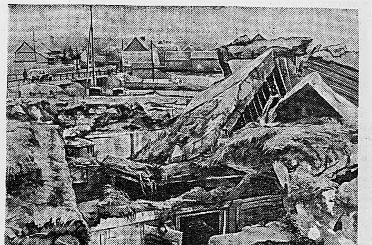
2. БЕРЛИНСКОЕ НАПРАВЛЕНИЕ. Взорванные немецкие доты.