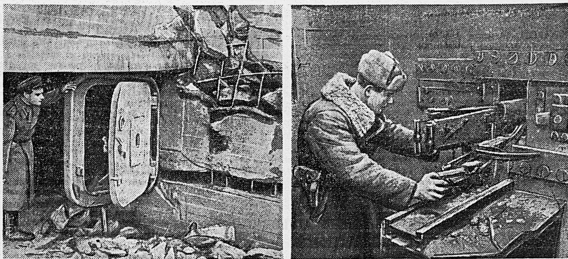
3. БЕРЛИНСКОЕ НАПРАВЛЕНИЕ. В разбитых немецких дотах. Слева — стальная дверь каземата. Справа — пулеметная установка в доте.

Эти бои будут неслегкиими боями. Но есть ли человек в мире, сомневающийся в их исходе? Эти последние, решительные бои принесут победу, мир и счастье советскому народу и народам всего мира.