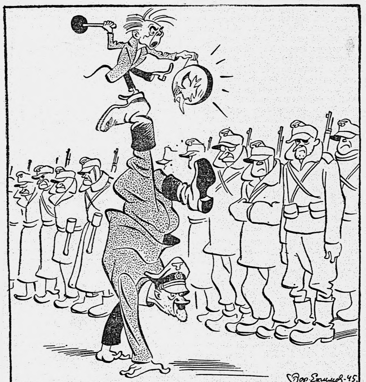
Выступление выездного вокально-акробатического дуэта.