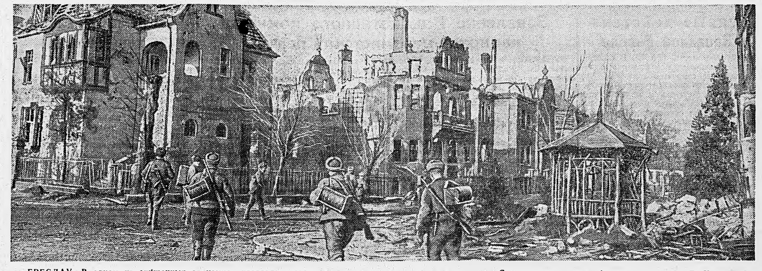
БРЕСЛАВ. В одном из очищенных от немцев кварталов города.

Обреченный на гибель враг признает во всем успехах. От бойцов требуется удостоверенная бдительность, чтобы противостоять провкам гитлеровцев.